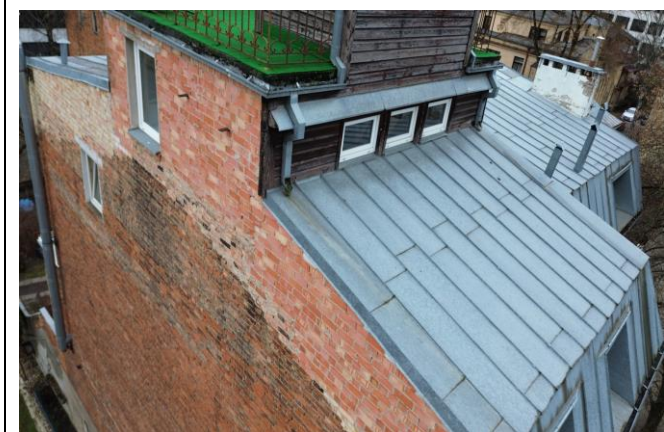
Nuotrauka Nr. 3