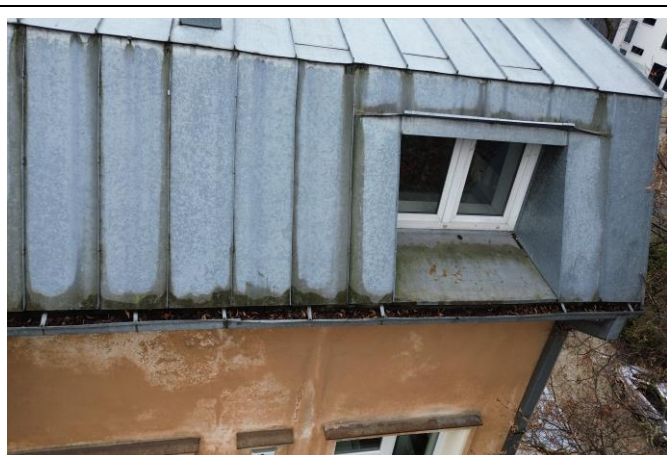
Nuotrauka Nr. 2