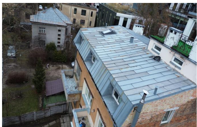
Nuotrauka Nr. 4

Aktą paruošė: Techninės priežiūros inžinieriai: Linas Grimalauskas