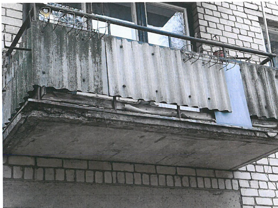
Nuotrauka Nr.11 ( 21 bt. )