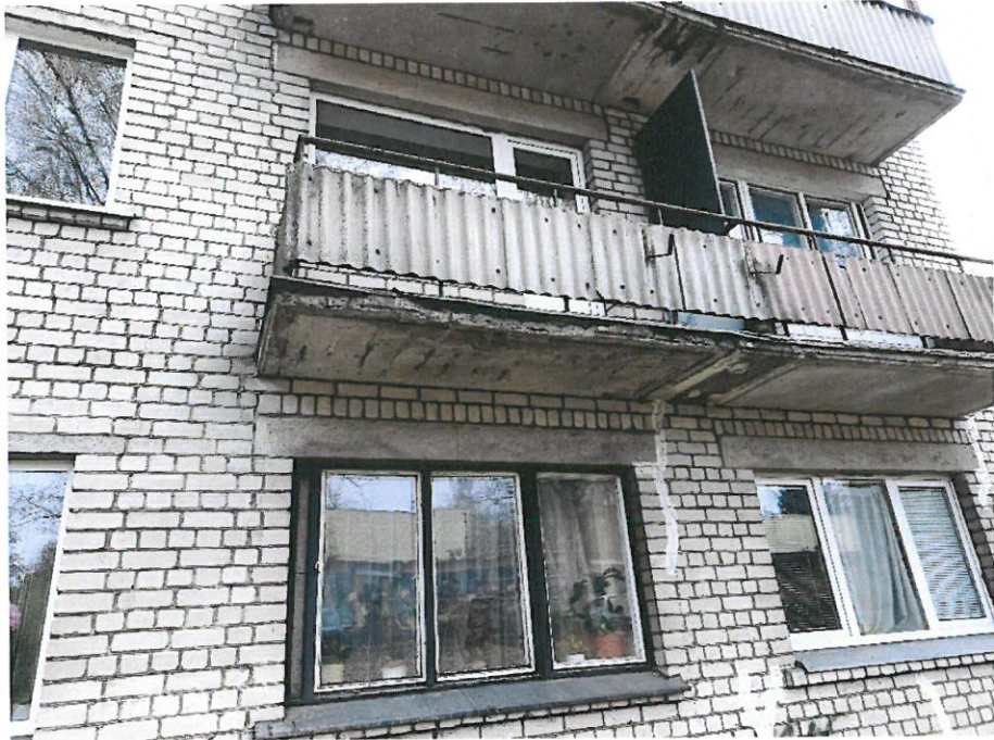
Nuotrauka Nr.15 ( 8,7 bt.)