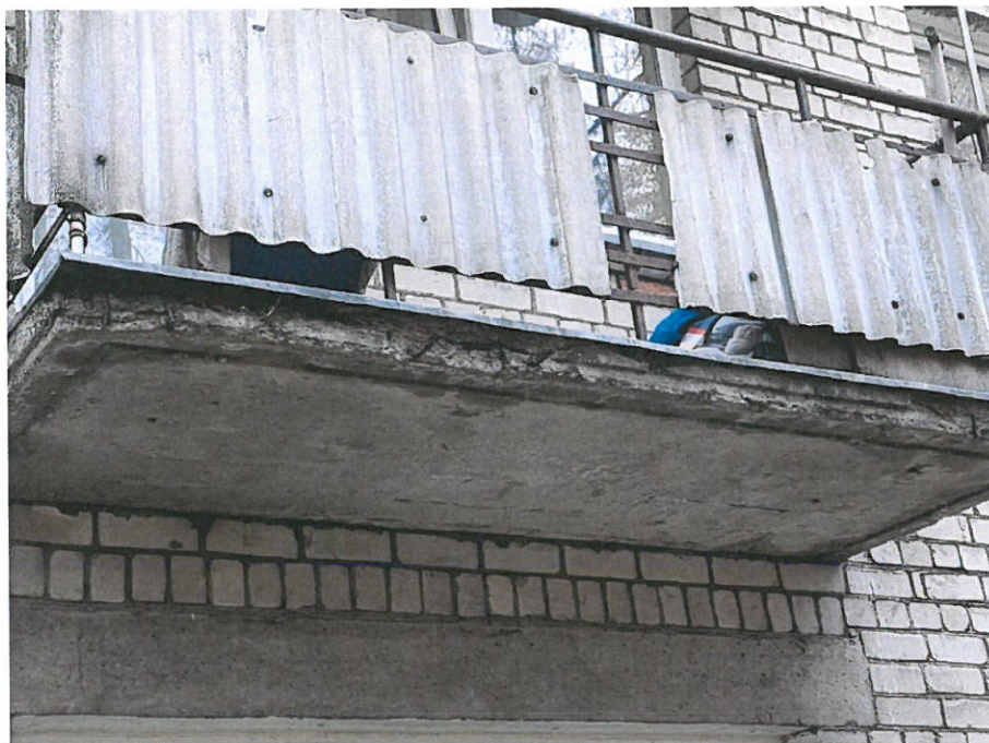
Nuotrauka Nr.9 ( 32 bt. )