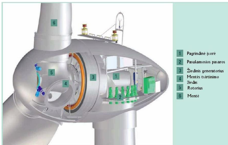
2 pav. Gondola

Numatomas bokšto aukštis yra iki 169 m, tačiau jis gali kisti priklausomai nuo elektrinės galingumo. Kuo didesnis bokštas, tuo didesnis vėjo greitis. Bokšto kaip statinio aukštis skaičiuojamas nuo suplanuoto žemės paviršiaus iki bokšto konstrukcijos aukščiausio taško.