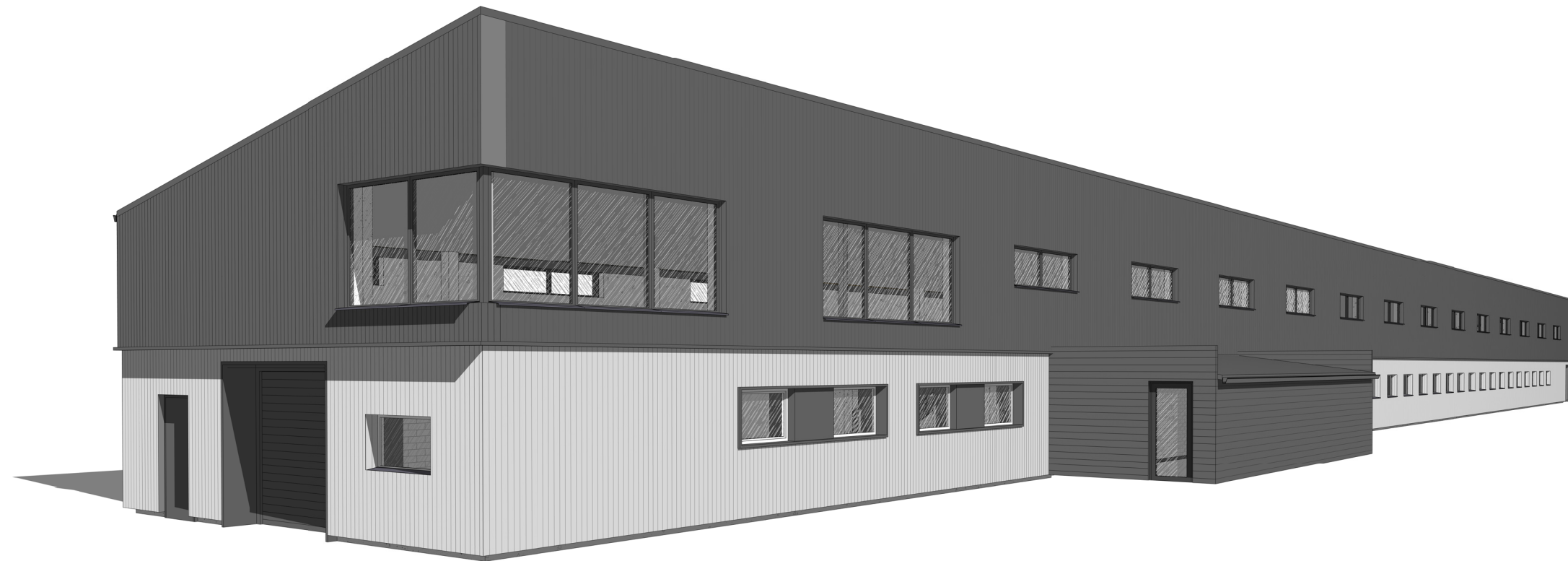
Pietryčių kampas 1 : 1