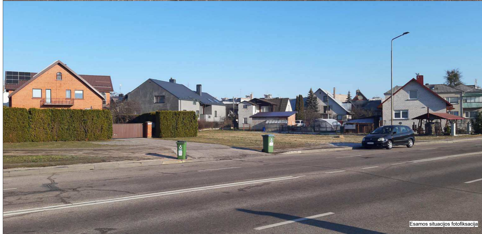
Esamos situacijos fotofiksacija