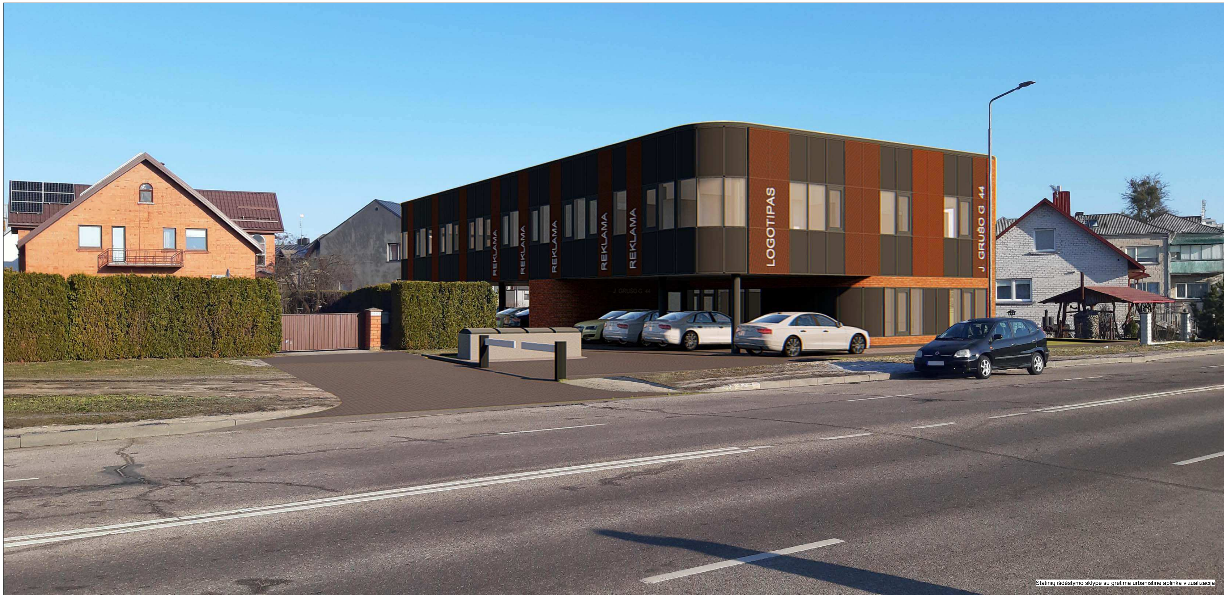
Statinių išdėstymo sklype su gretima urbanistine aplinka vizualizacija