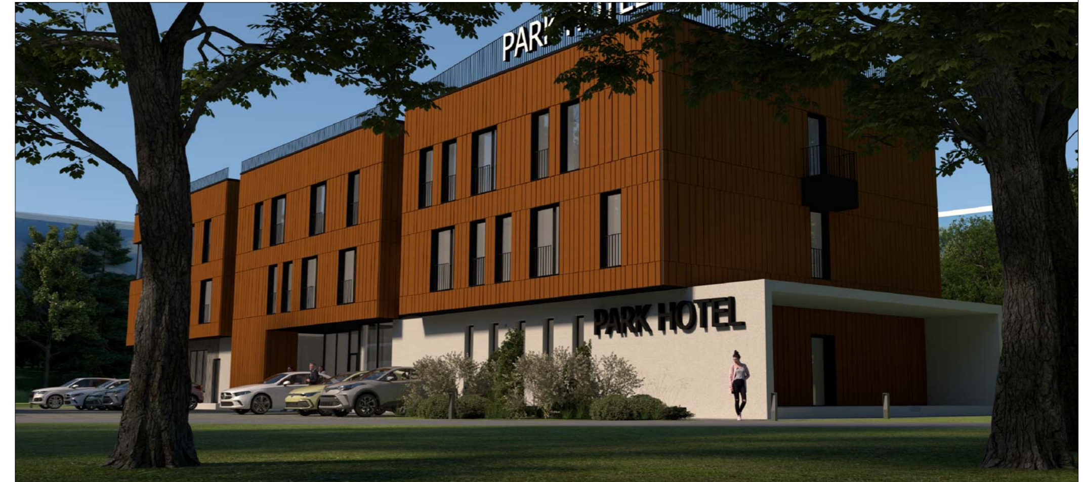
VAIZDAS IŠ MĒLYNIŲ GATVĒS