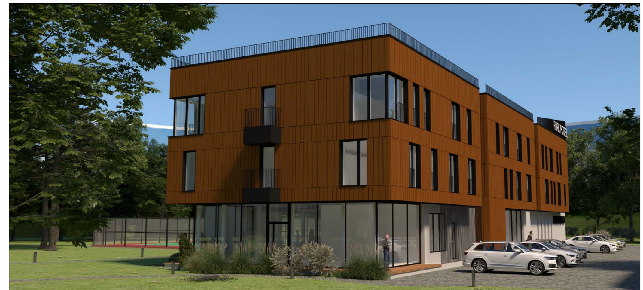
VAIZDAS IŠ VIDINĒS SKLYPO PUSĒS