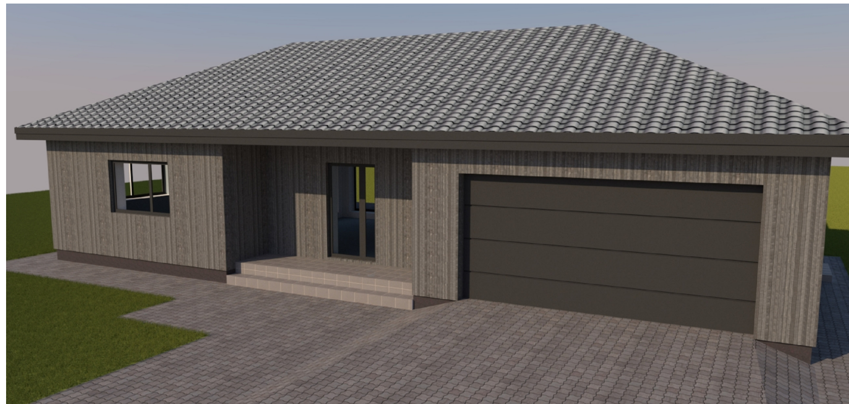
1 pav. VAIZDAS IŠ RYTINĖS KIEMO PUSĖS