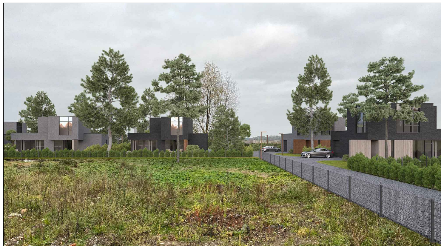
VIZUALIZACIJA ESAMOJE APLINKOJE