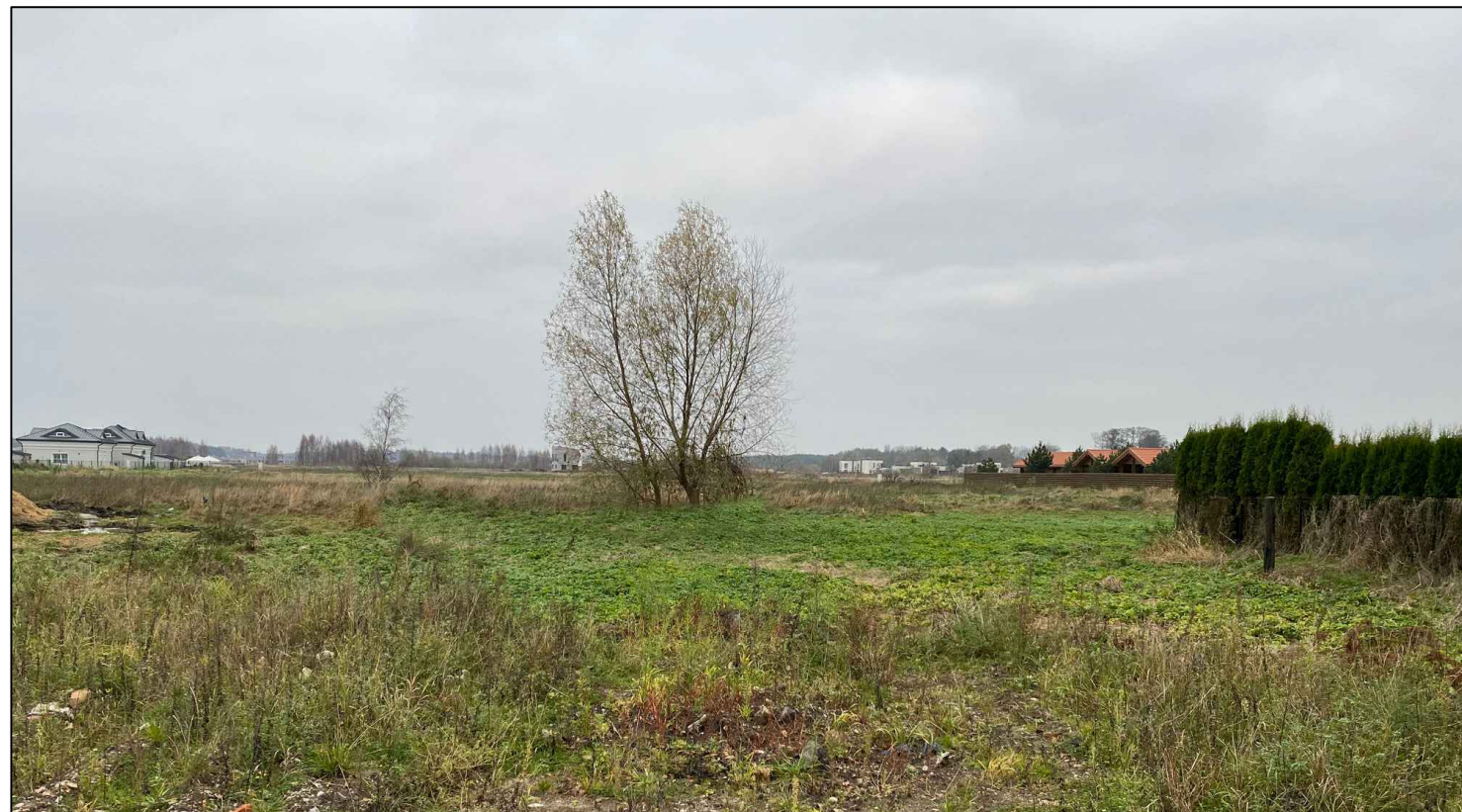
ESAMOS SITUACIJOS FOTOFIKSACIJA