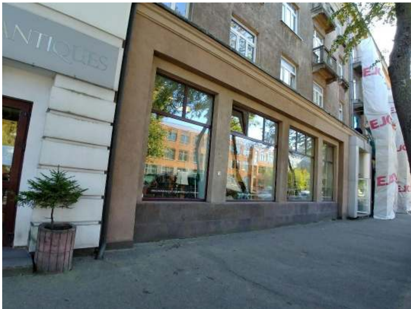
S. Daukanto 2 pagrindinio fasado fragmento fotofiksacija-esama padėtis.