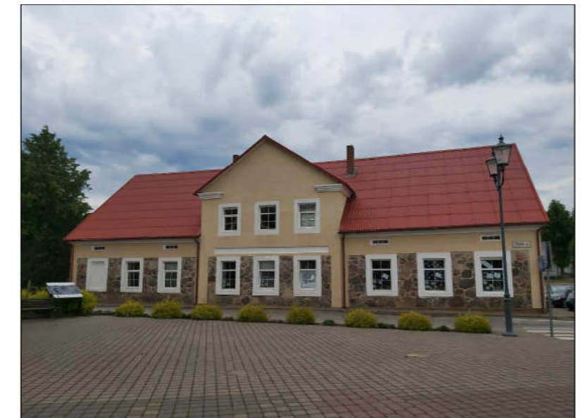
Fasado tarp ašių 1-5 fotofiksacija