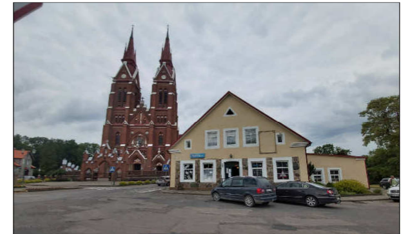
Fasado tarp ašių A-D fotofiksacija