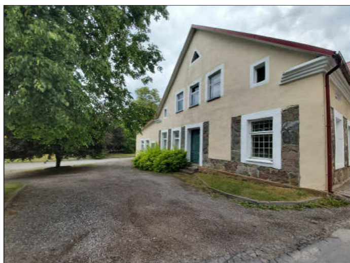
Fasado tarp ašių D-A fotofiksacija