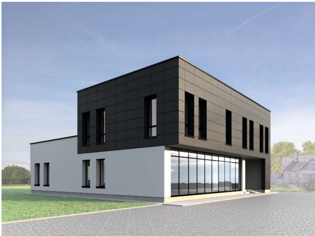
Iš J.Lukšos gatvės pusės