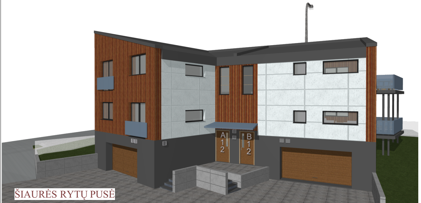
ŠIAURĖS RYTŲ PUSĖ