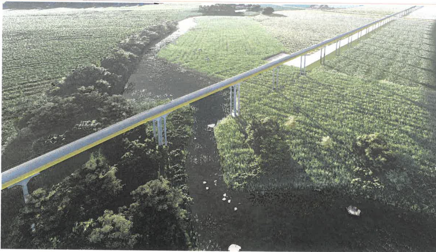
VIZUALIZACIJA. ESTAKADOS VAIZDAS VIRŠ KRUOJOS UPĖS