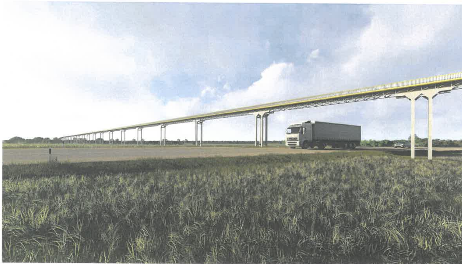
VIZUALIZACIJA. ESTAKADOS VAIZDAS VAŽIUOJANT LINKUVOS KRYPTIMI