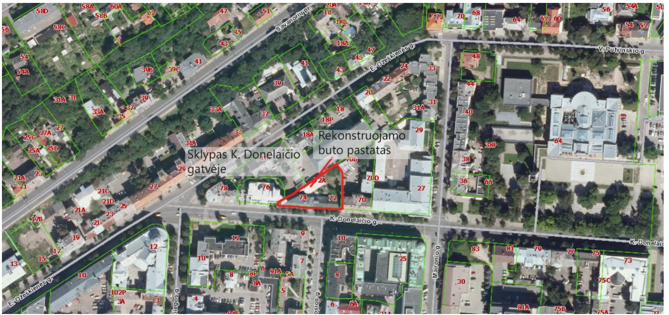
1 pav. Sklypo situacijos schema.