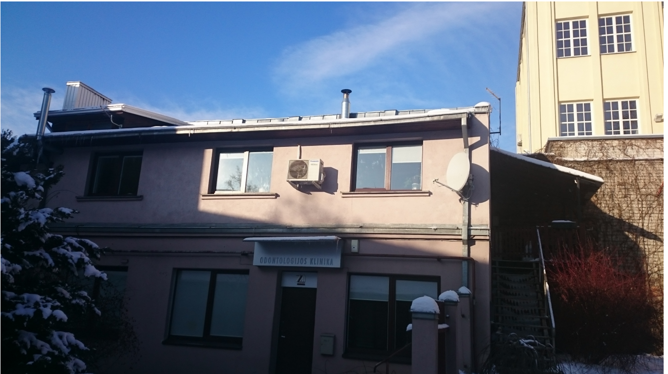
7 pav. Gyvenamasis pastatas K. Donelaičio g. 72A iš pietrytinės sklypo dalies.