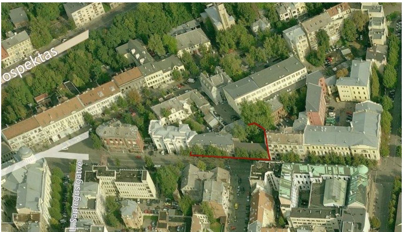
2 pav. Sklypo K. Donelaičio gatvėje vaizdas iš pietinės pusės.