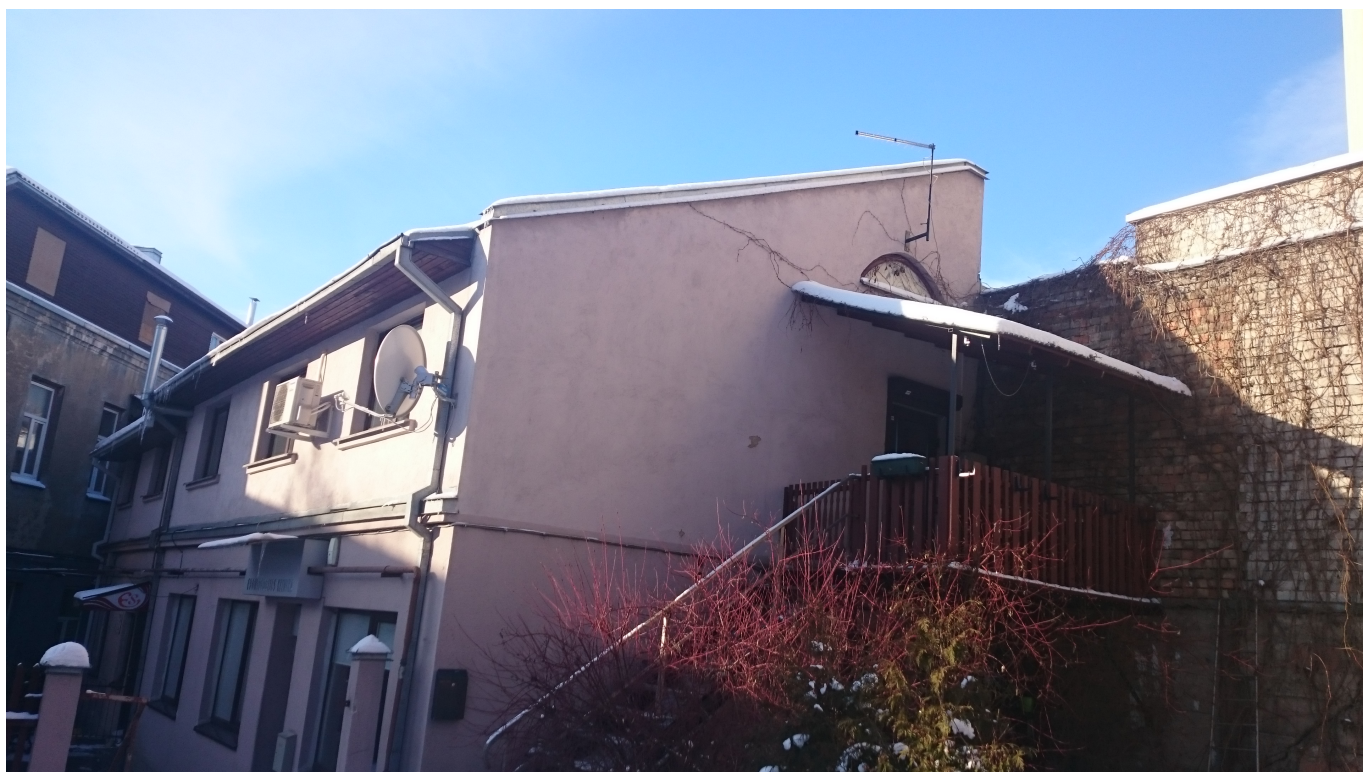
6 pav. Gyvenamasis pastatas K. Donelaičio g. 72A iš rytinės sklypo dalies.