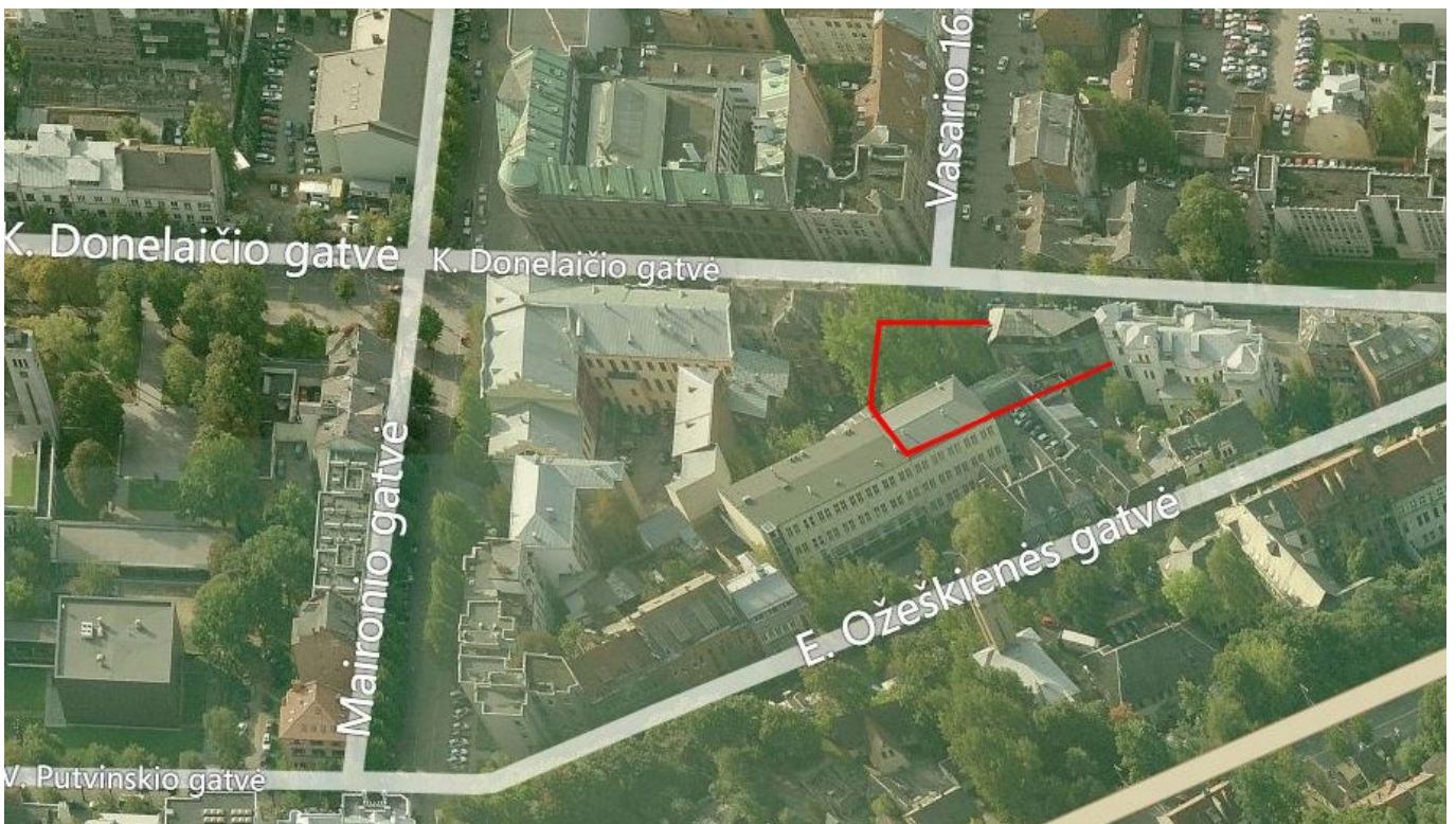
4 pav. Sklypo K. Donelaičio gatvėje vaizdas iš šiaurinės pusės.