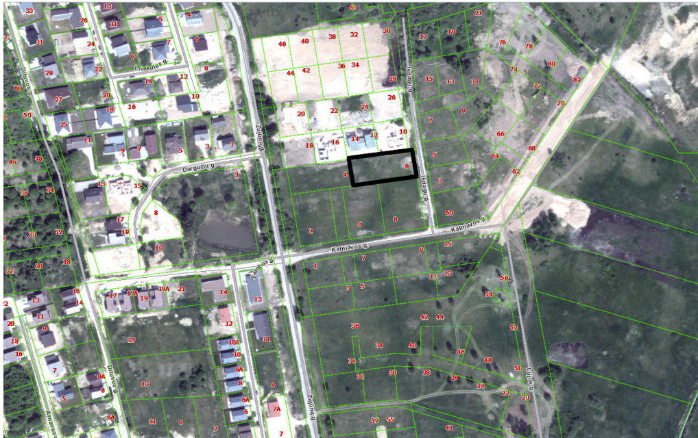
1 pav. Situacijos schema

Sklypas kad. nr. 0101/0167:3456, pagrindinė naudojimo paskirtis kita, naudojimo būdas – daugiabučių gyvenamųjų pastatų ir bendrabučių teritorijos. Sklypo statybos vieta šiuo metu neužstatyta, be medžių ir krūmų, rytinė sklypo riba ribojasi su Išdagų g.