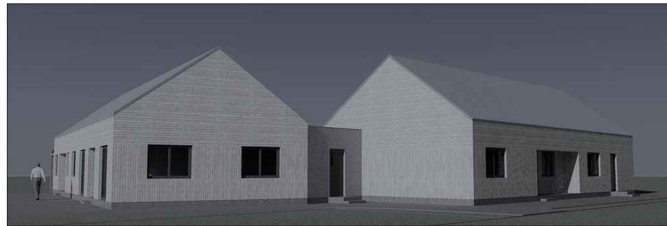
pastato vizualizacija iš šiaurės rytinės pusės (nuo privažiavimo keliuko)