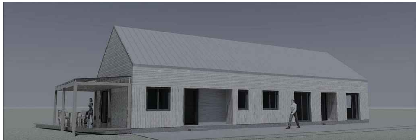
pastato vizualizacija iš pietrytinės pusės (nuo Liepų gatvės)