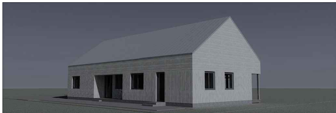
pastato vizualizacija iš šiaurės vakarinės pusės (nuo privažiavimo keliuko)