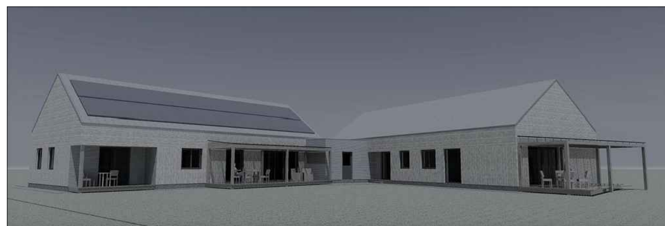
pastato vizualizacija iš pietvakarinės pusės (nuo gretimo sklypo)