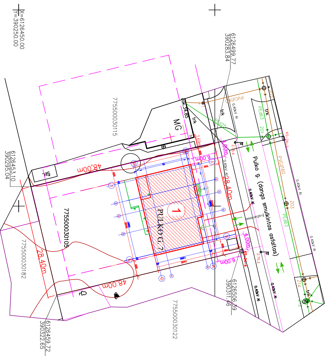
EKSPLIKACIJA PROJEKTUOJAMAS PASTATAS