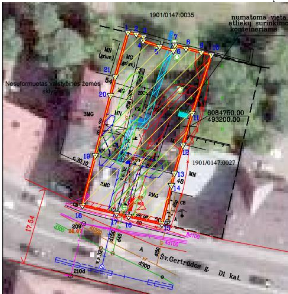
Projekto rengėjas: Donatas Kraniauskas