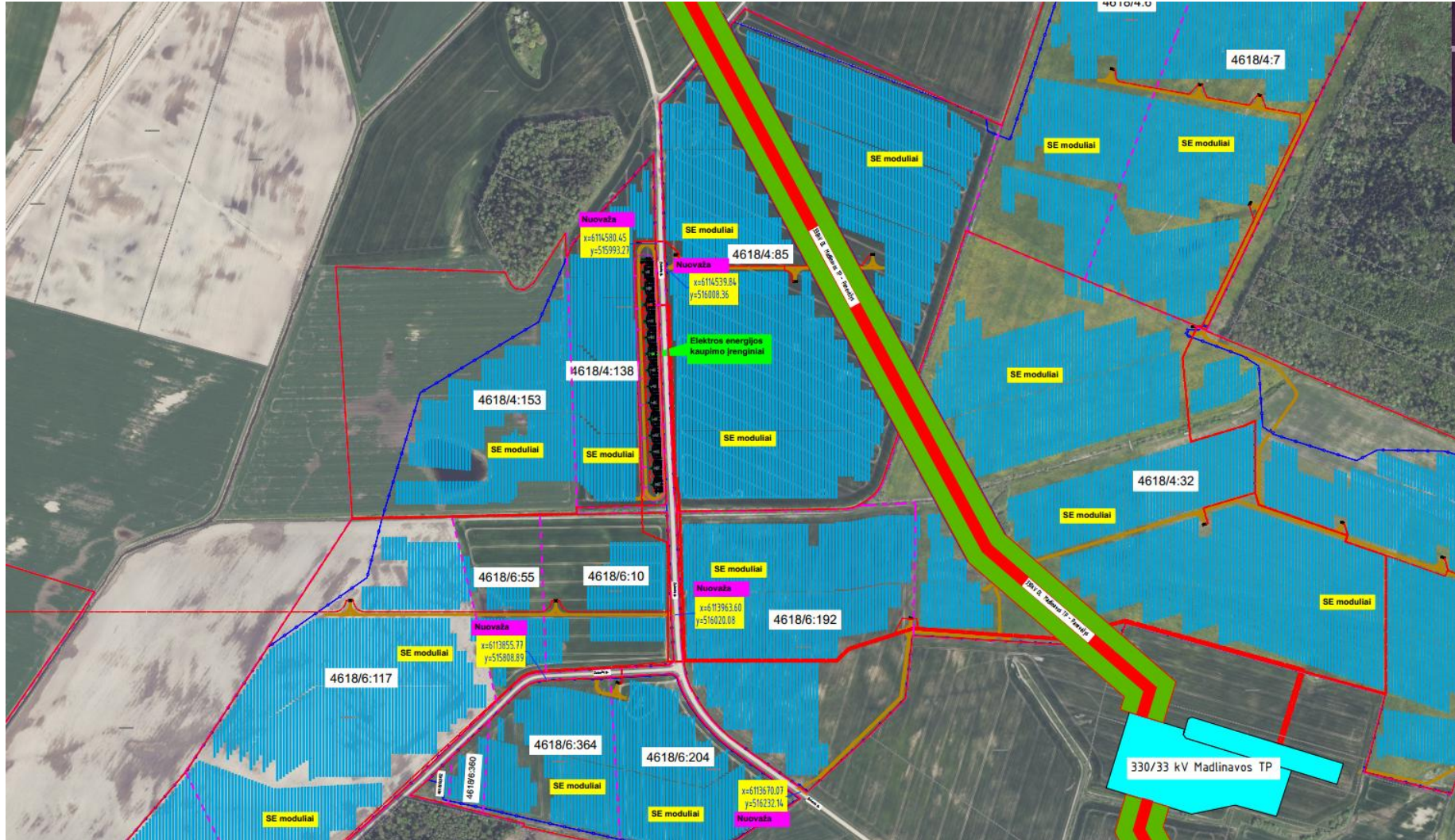
1 pav. UAB „PV INVESTMENT GROUP“ PLANUOJAMŲ ĮRENGINIŲ / STATINIŲ SKLYPO PLANAS