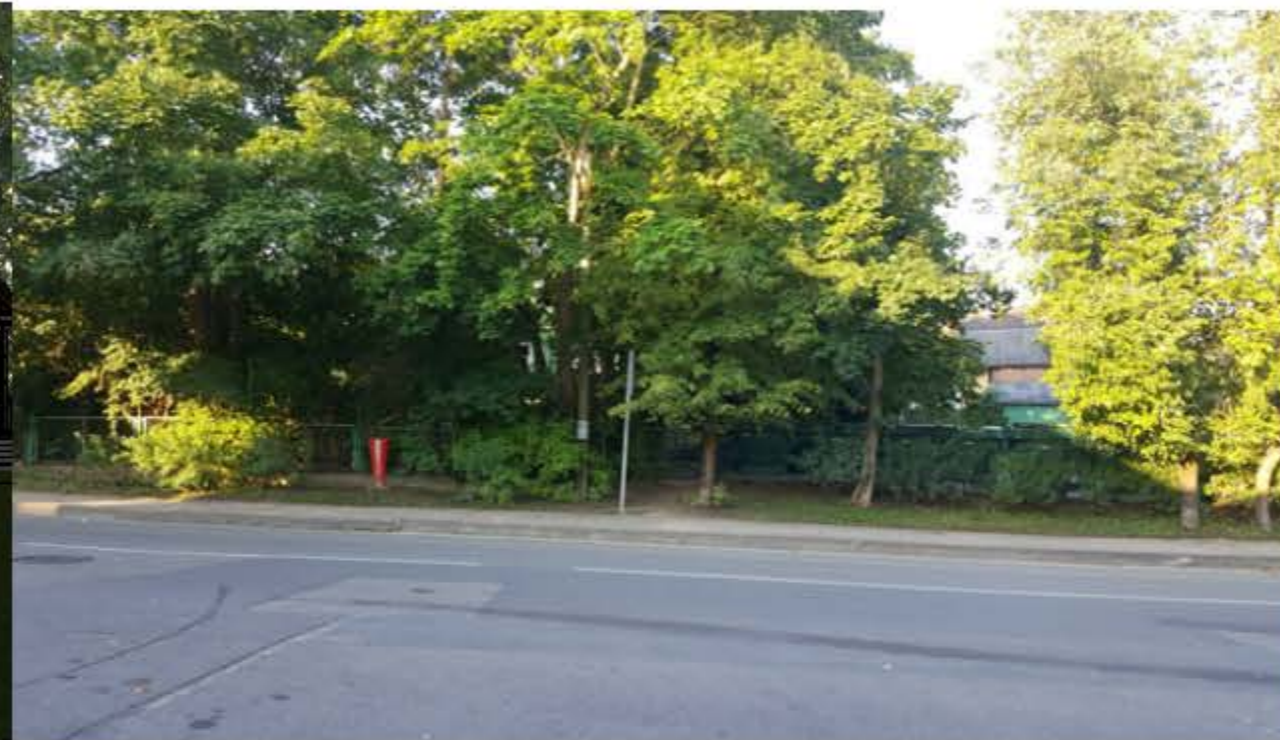
RYTINIS SKLYPO VAIZDAS , IŠ GEDIMONO GATVĖS