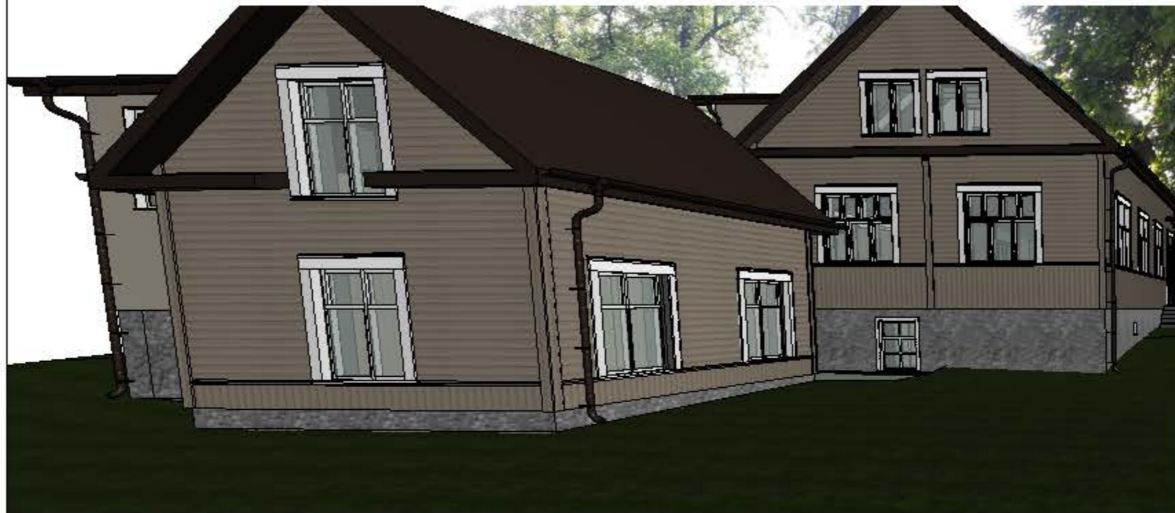
RYTINIS SKLYPO VAIZDAS , KIEMO VIDUJE