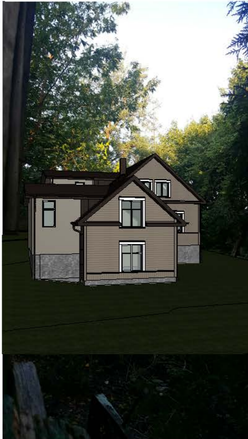
RYTINIS SKLYPO VAIZDAS, ŠIEK TIEK PIEČIAU , KIEMO VIDUJE