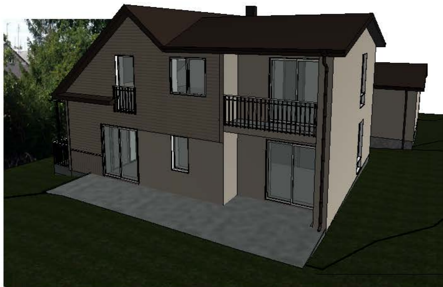
VAKARINIS SKLYPO VAIZAS, KIEMO VIDUJE