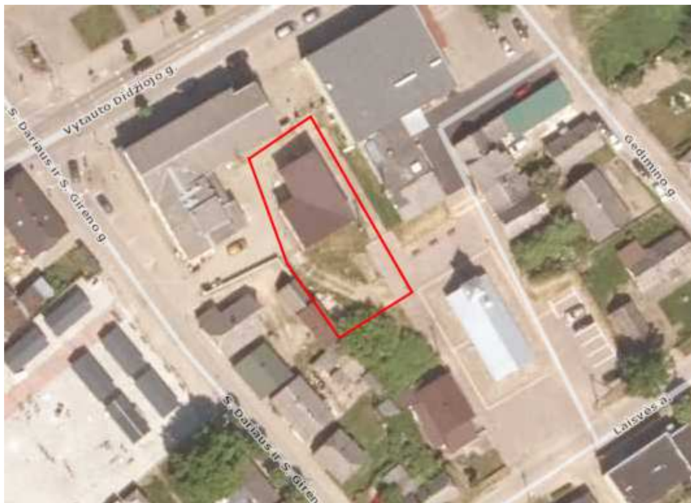
1 pav. Situacijos schema

Sklypas yra šalia Kultūros paveldo objekto - Pakruojo ugniagesių draugijos stoginės pastatas, (unik.k.30734), patenka į Pakruojo ugniagesių draugijos stoginės pastato vizualinės apsaugos pozonį.