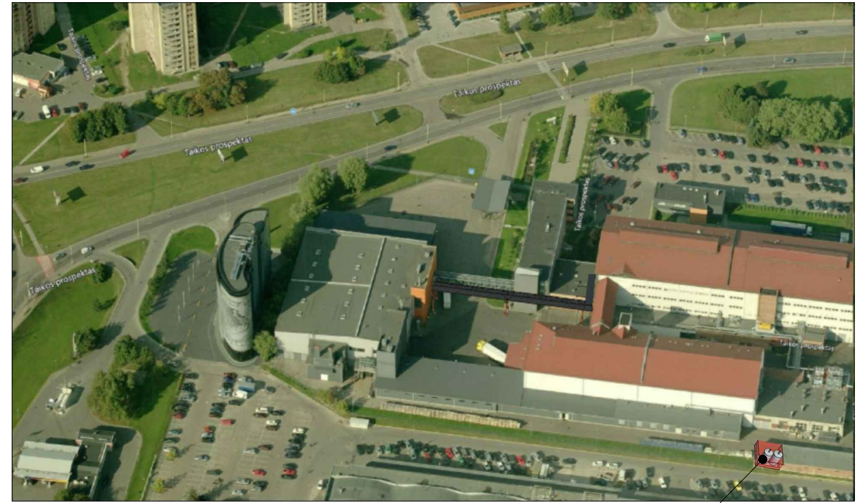
GRIAUNAMA PASTATO 11G1P DALIS IR PROJEKTUOJAMOS TALPYKLOS