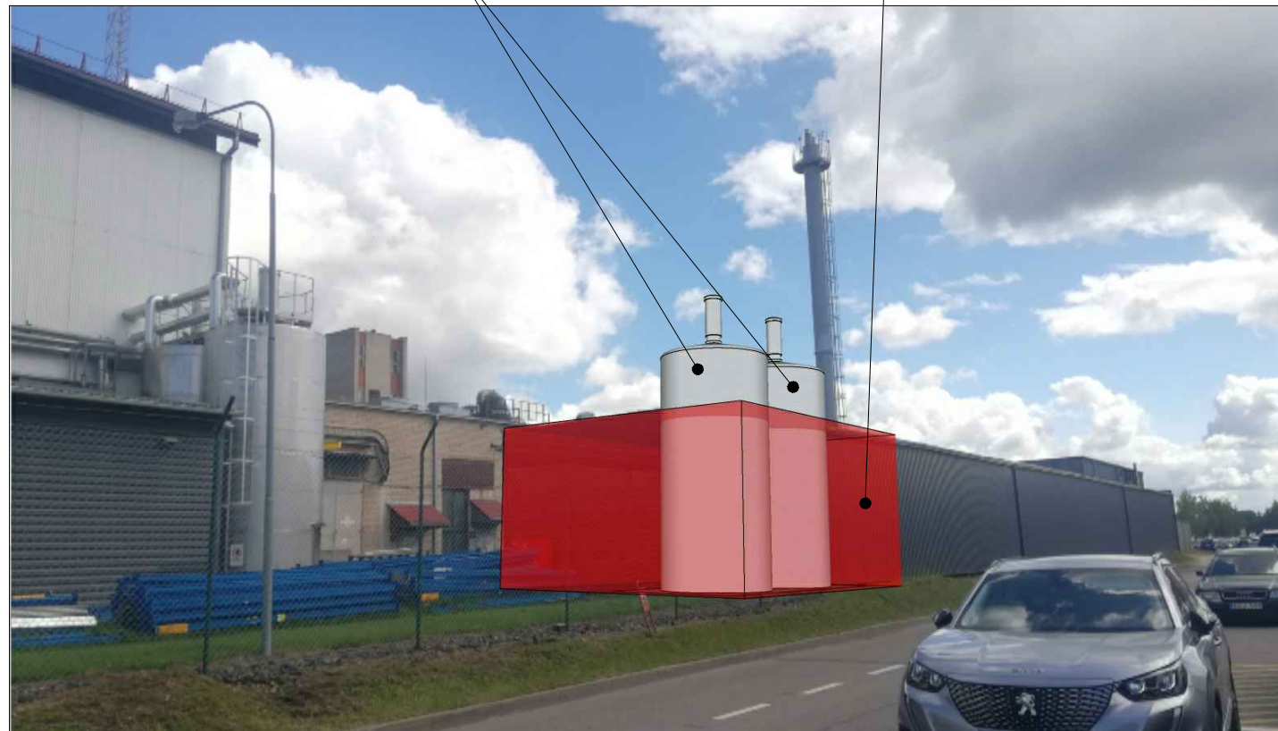
GRIAUNAMA PASTATO 11G1P DALIS