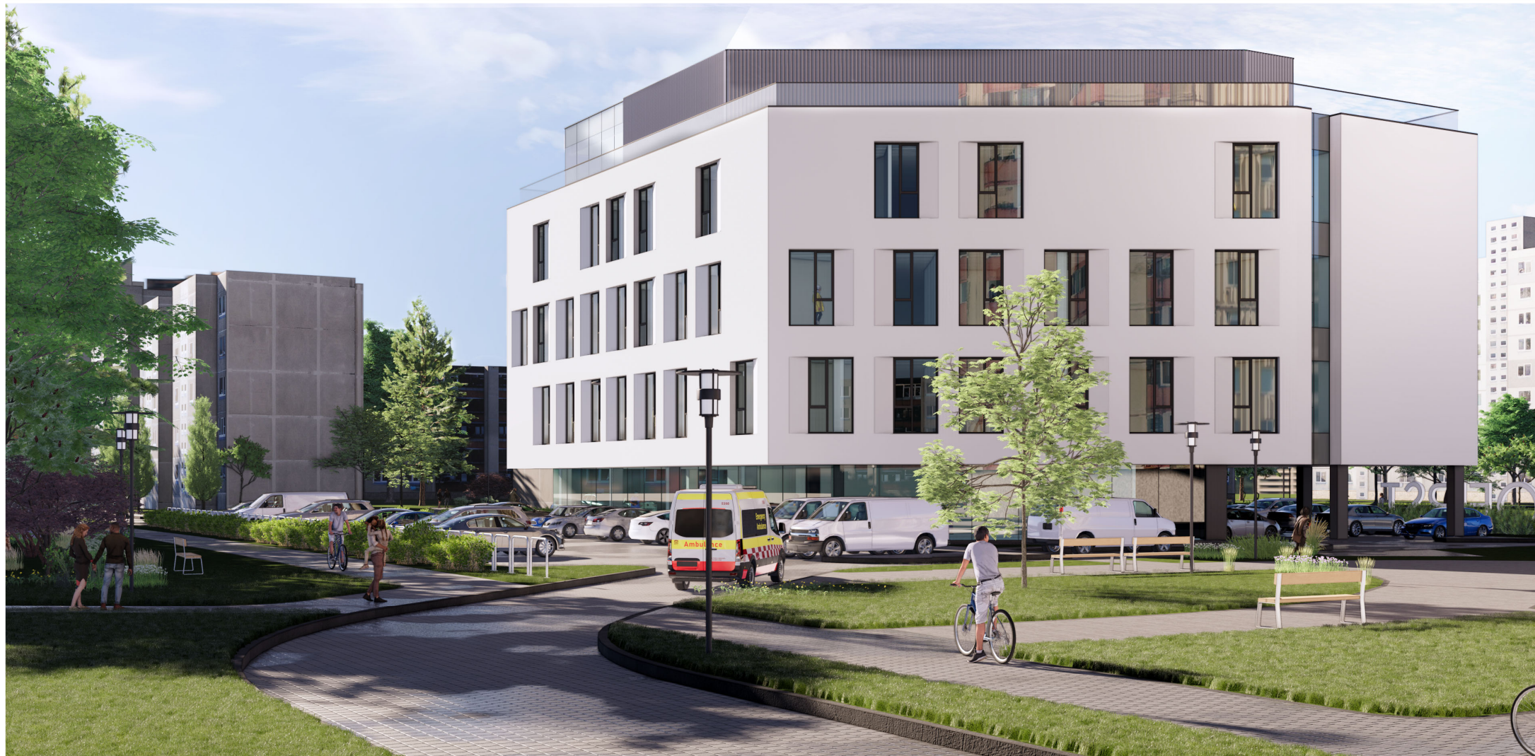
VIZUALIZACIJA NUO ŠV PUSĖS (NUO ĮVAŽIAVIMO IŠ P. PLECHAVIČIAUS g.)