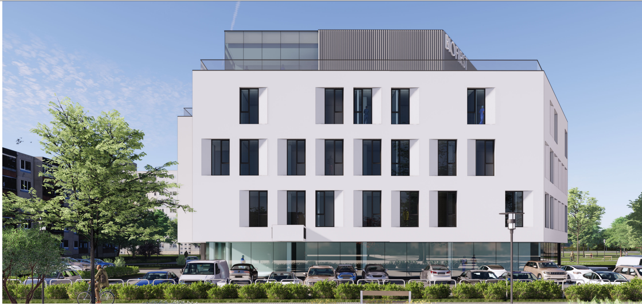
VIZUALIZACIJA NUO ŠIAURĖS PUSĖS