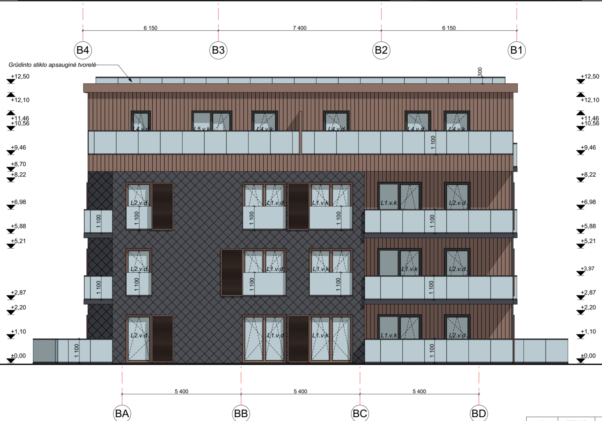
FASADAS BA-BD M 1:100