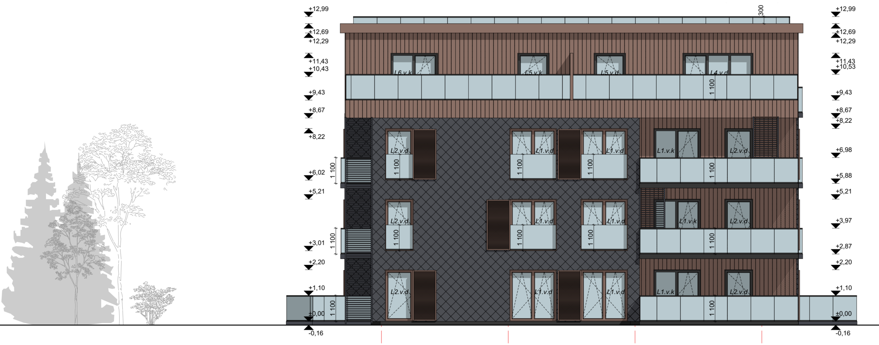
FASADAS A1-A4 M 1:100