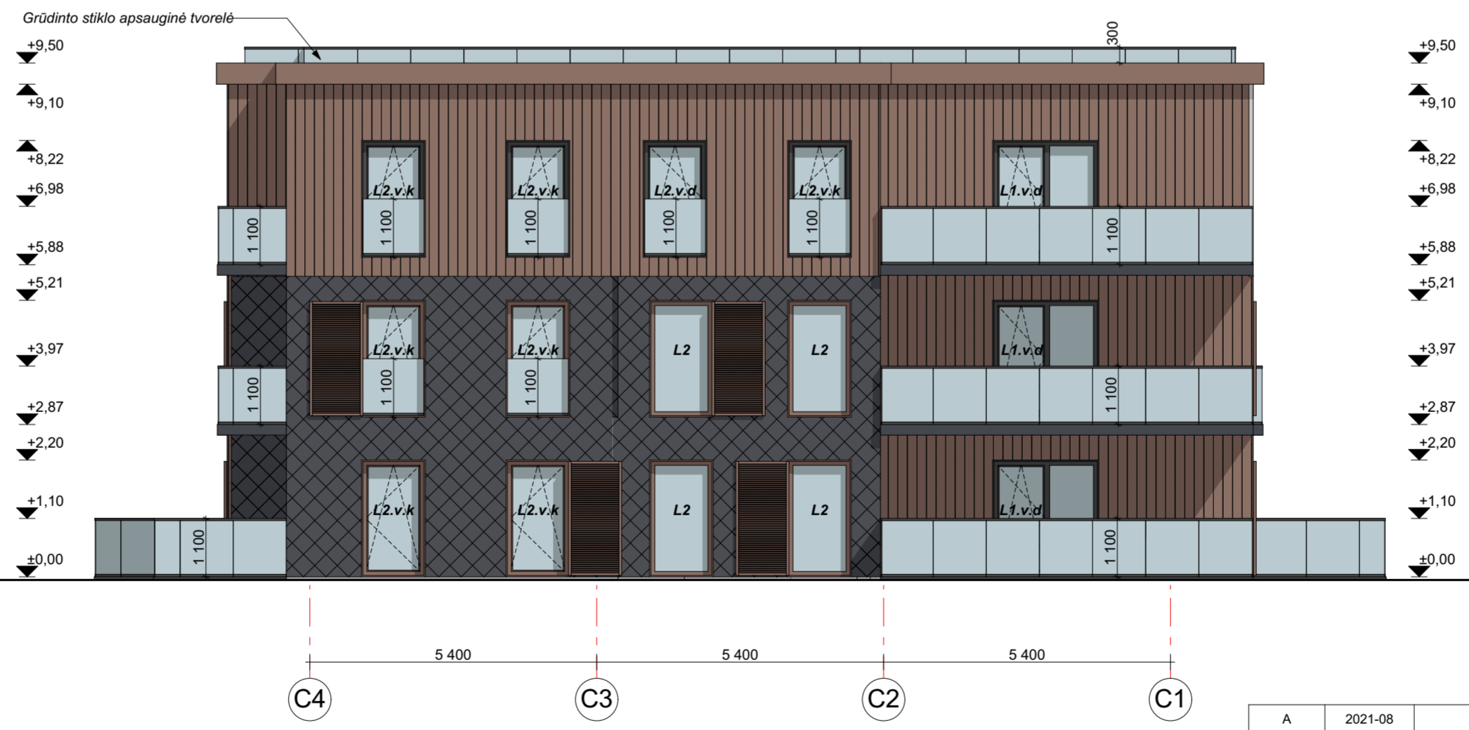
FASADAS C4-C1 M 1:100