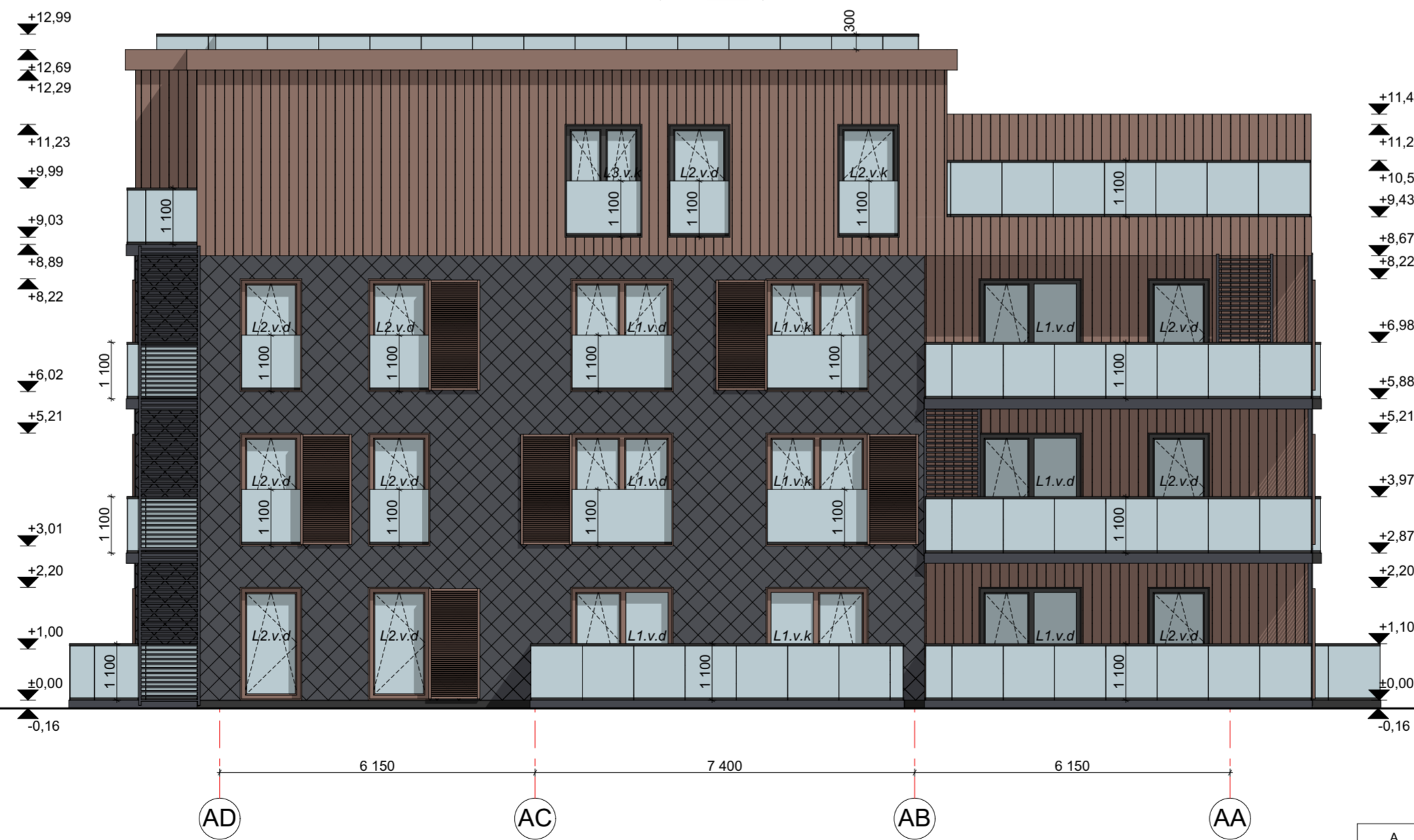
FASADAS AD-AA M 1:100