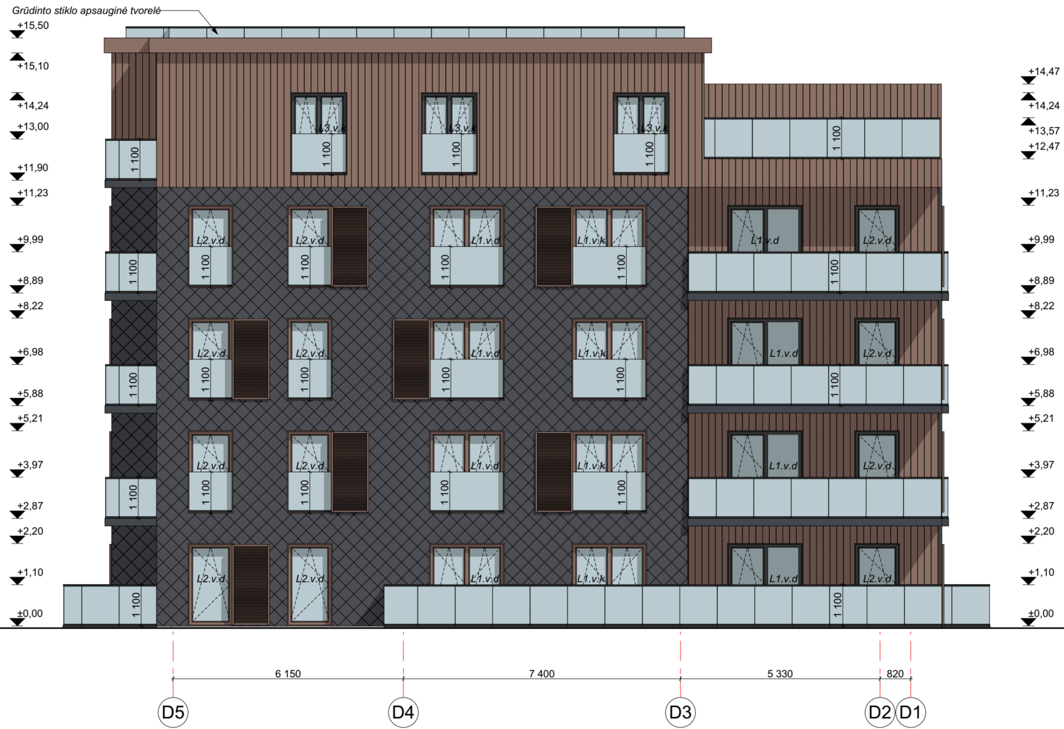
FASADAS D5-D1 M 1:100