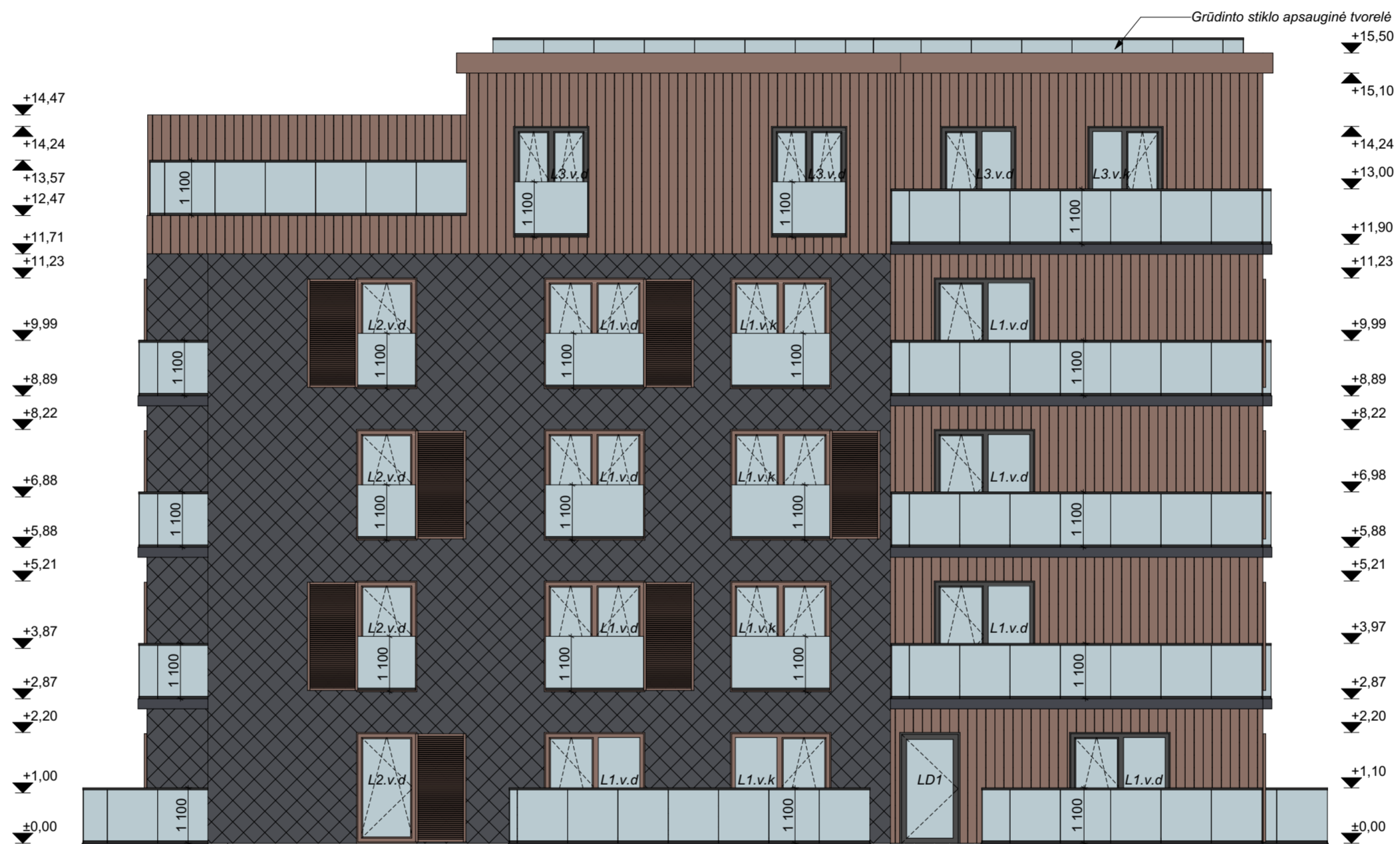
FASADAS D1-D5 M 1:100