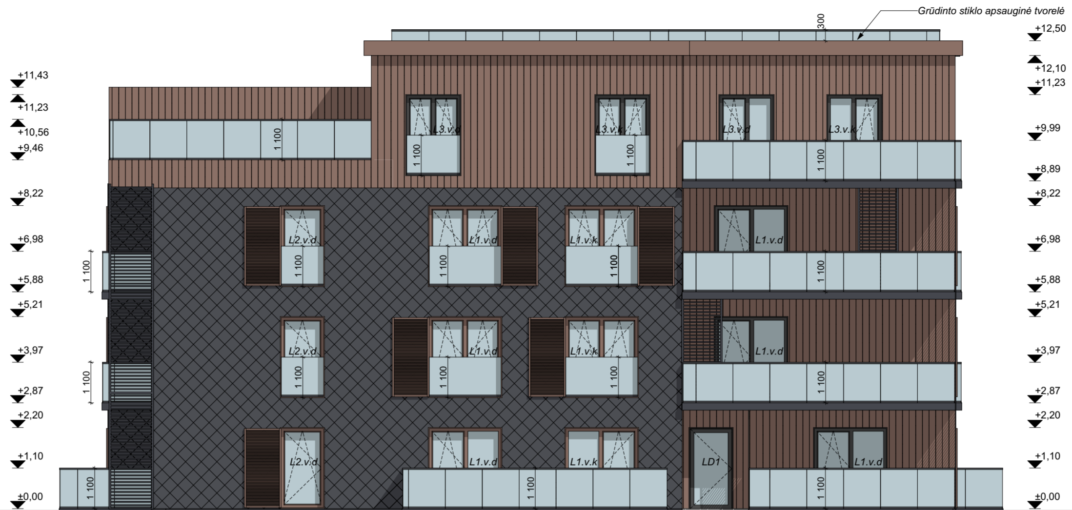
FASADAS B4-B1 M 1:100