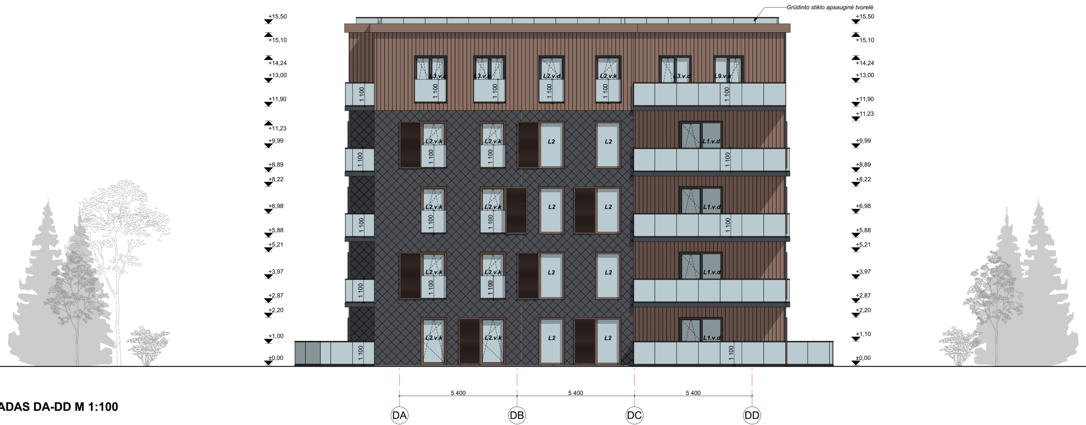
FASADAS DA-DD M 1:100