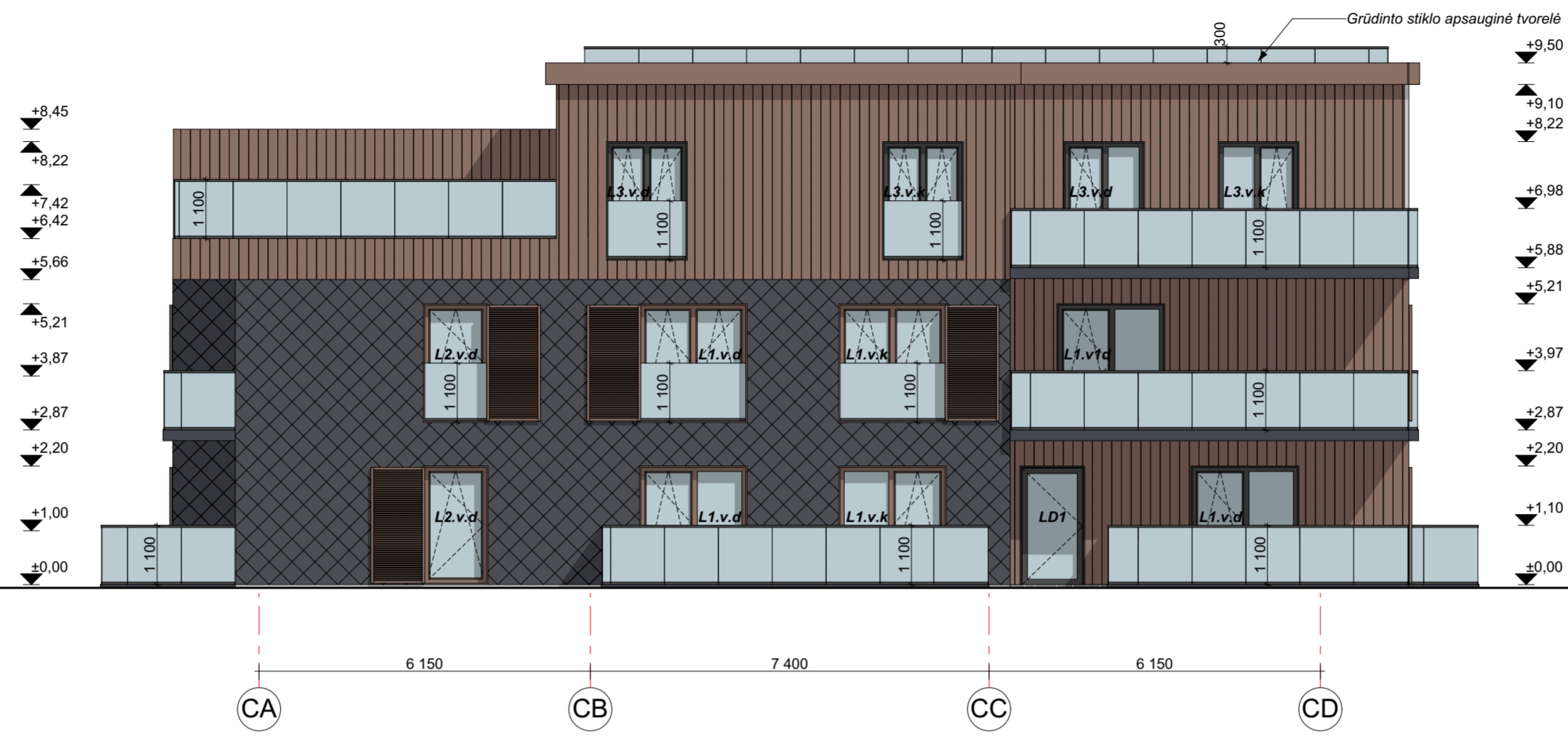
FASADAS CA-CD M 1:100