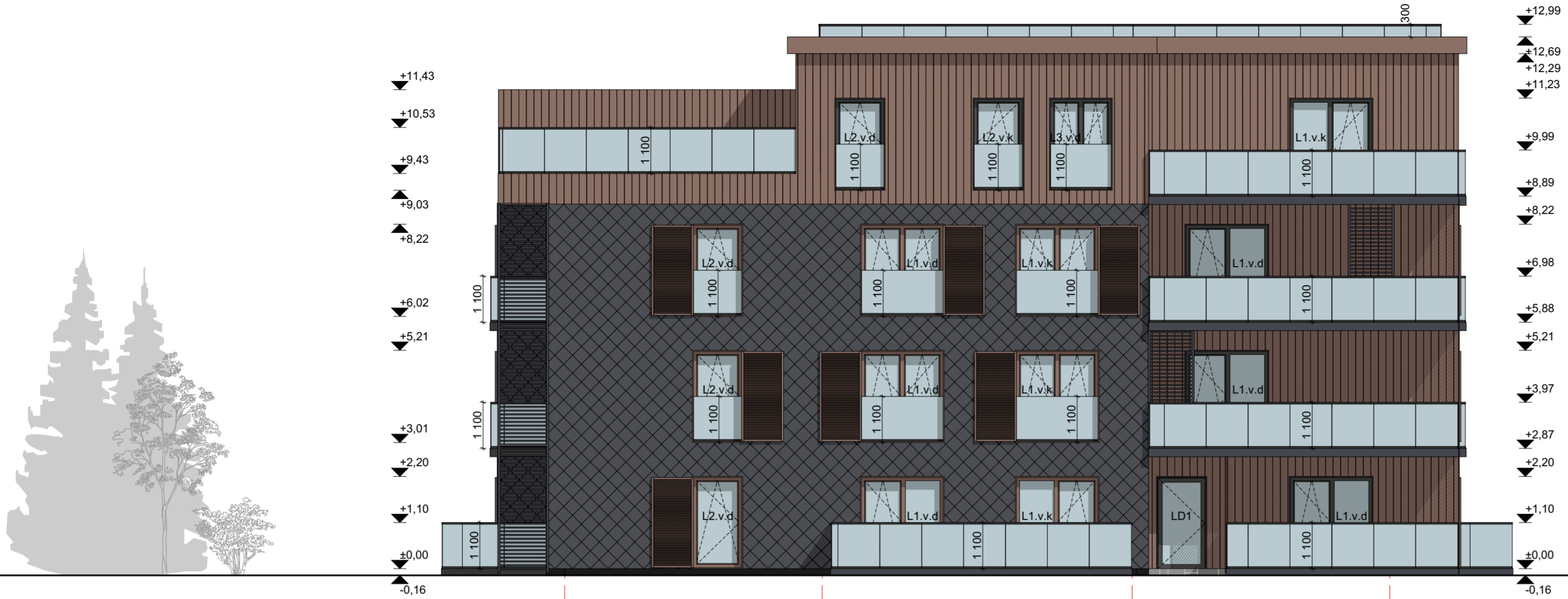
FASADAS AA-AD M 1:100