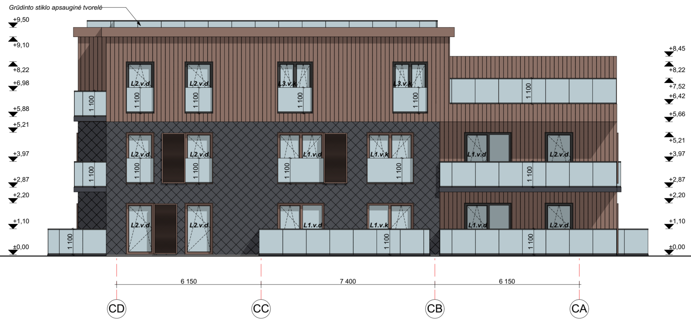
FASADAS CD-CA M 1:100