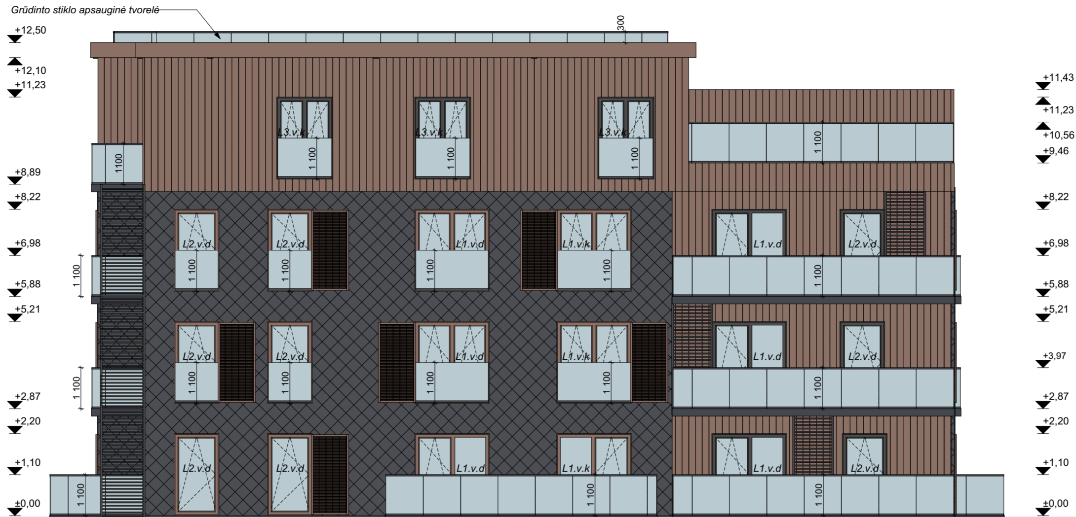
FASADAS B1-B4 M 1:100