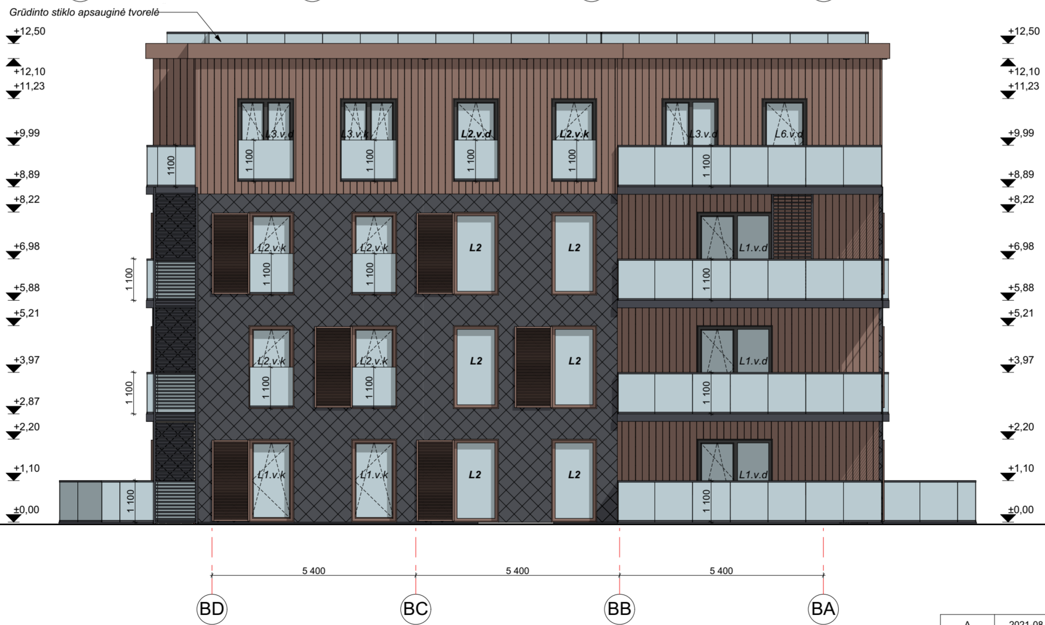
FASADAS BD-BA M 1:100