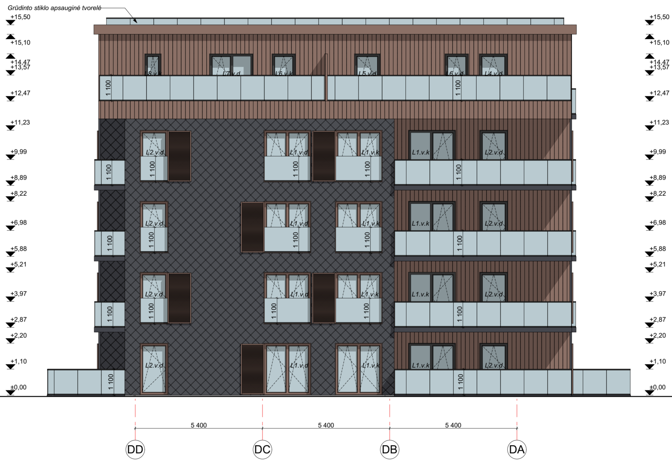
FASADAS DD-DA M 1:100