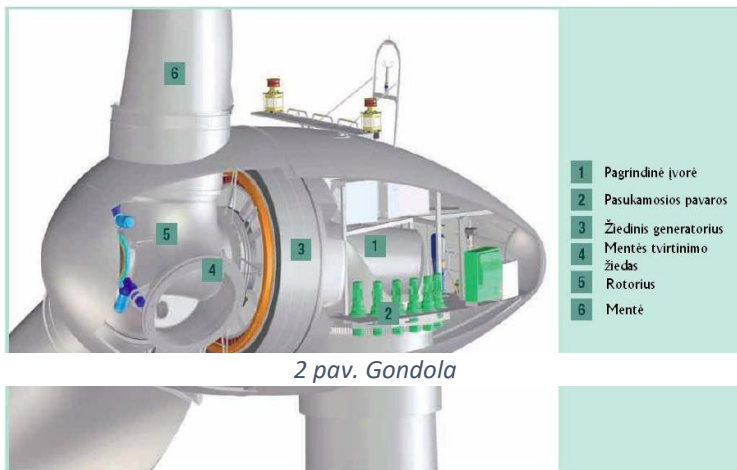
2 pav. Gondola

Gondoloje (2 pav.) yra patalpinti visi vėjo elektrinės mechanizmai, kurie rotacinę energiją paverčia elektros energija.