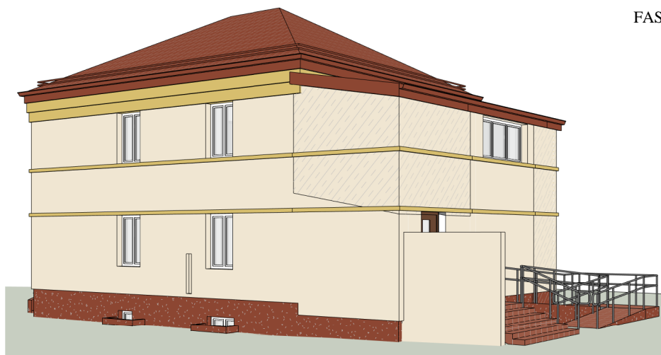
FASADAS IŠ KIEMO PUSĖS