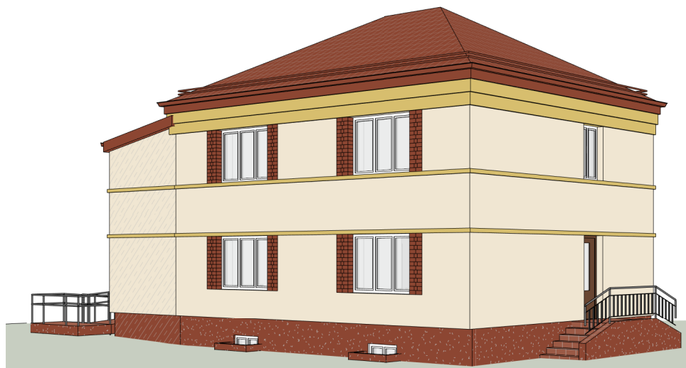
FASADAS IŠ KALVOS GATVĖS PUSĖS