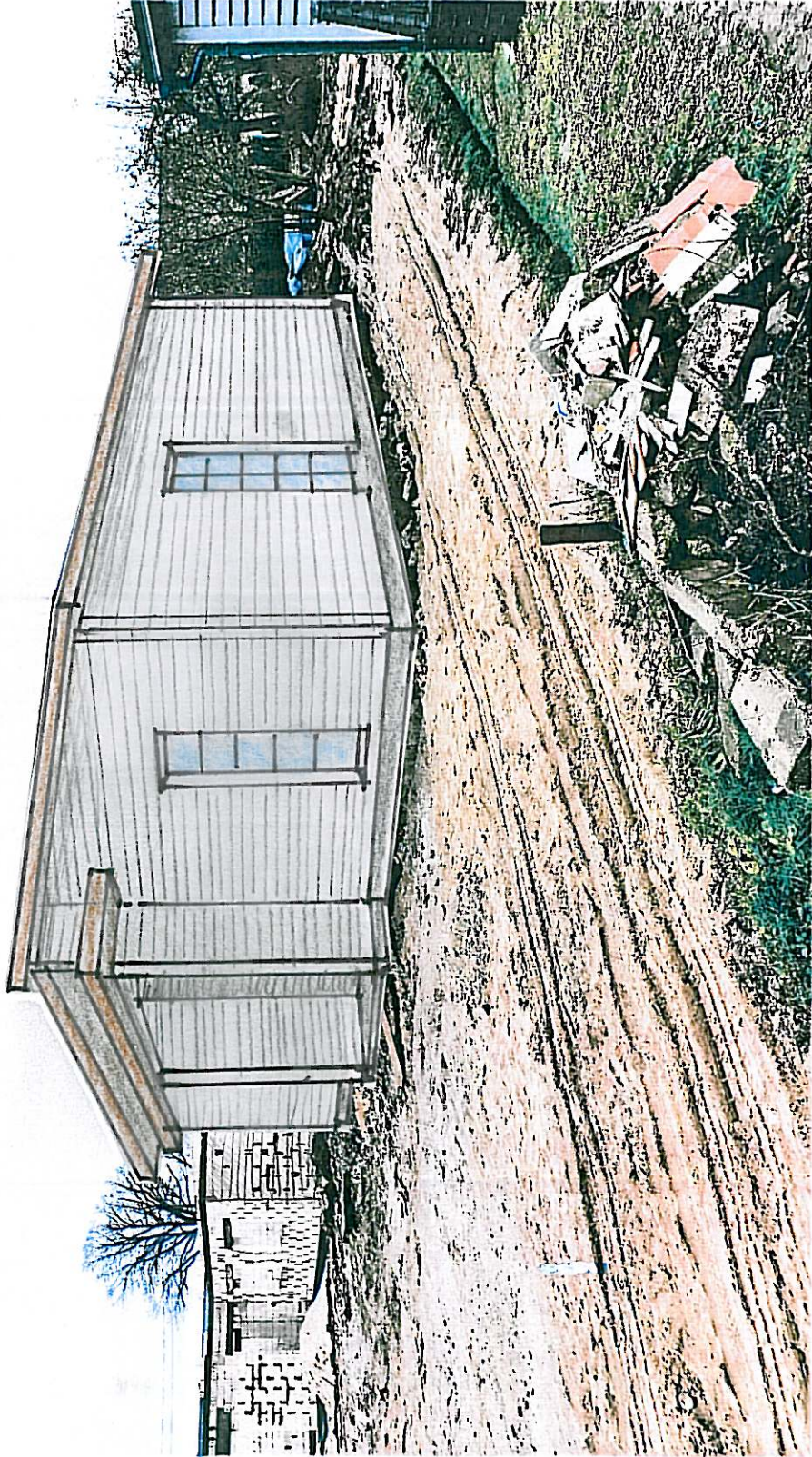
PROJEKTUOJAMAS PASTATAS ESANČIOJE URBANISTINĖJE APLINKOJE