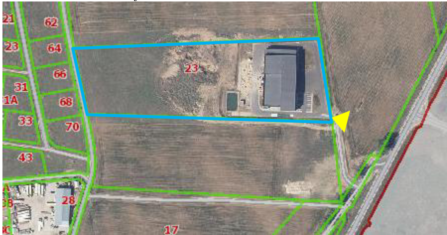
Schema- esama situacija

2.1. Reljefas. Sklypas gan taisyklingos formos. Reljefas lygus.