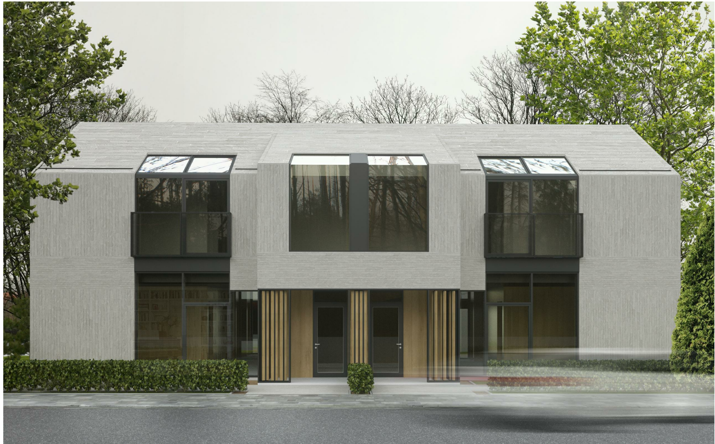
Fasadas iš Plytų g. pusės