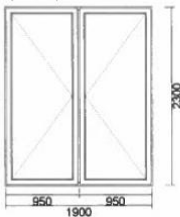
1) Durys 1-SK.Z F. (F+UR) 1900x2300 View Inside v