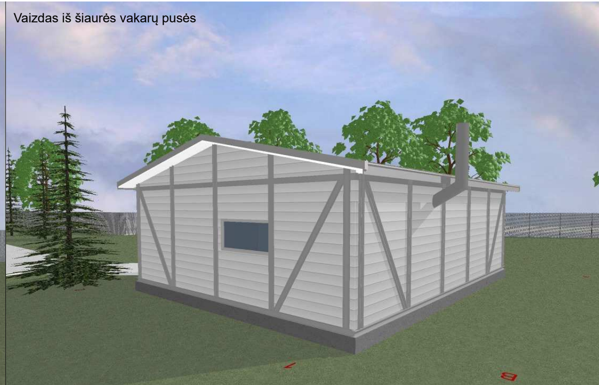
Vaizdas iš šiaurės vakarų pusės