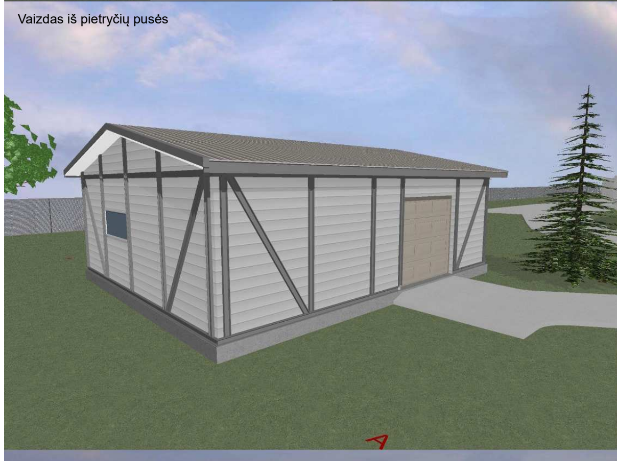
Vaizdas iš pietryčių pusės