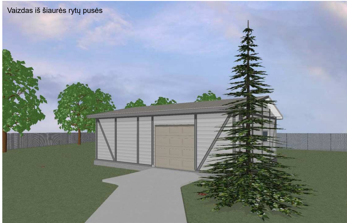
Vaizdas iš šiaurės rytų pusės