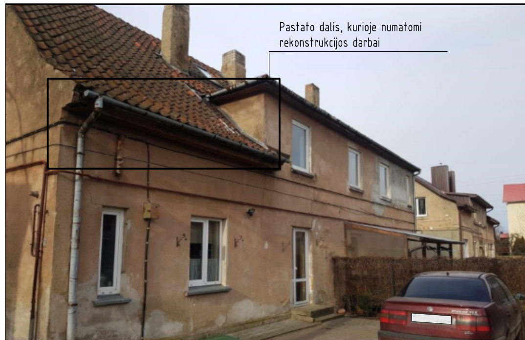
ESAMA PASTATO AŽUOLO G. 10 FOTOFIKSACIJA