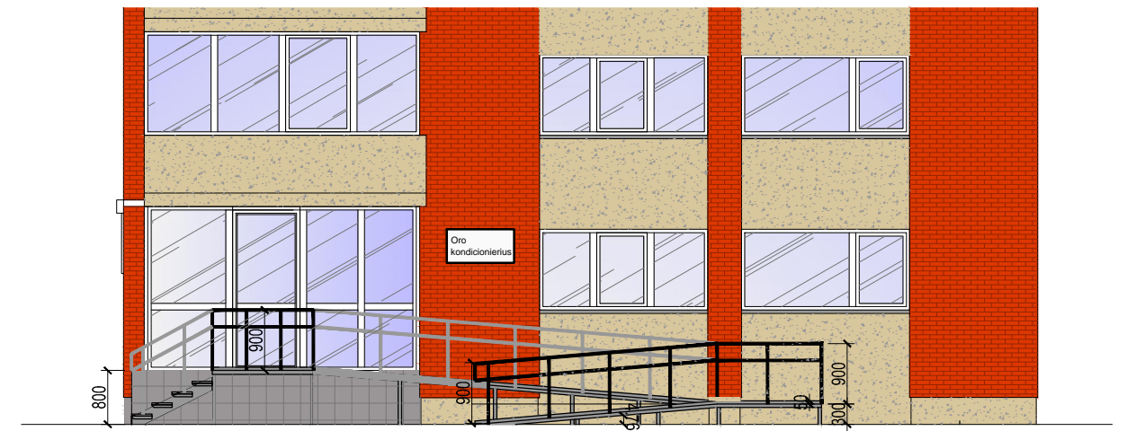
VAIZDAS IŠ PRIEKIO (pietinė pusė)