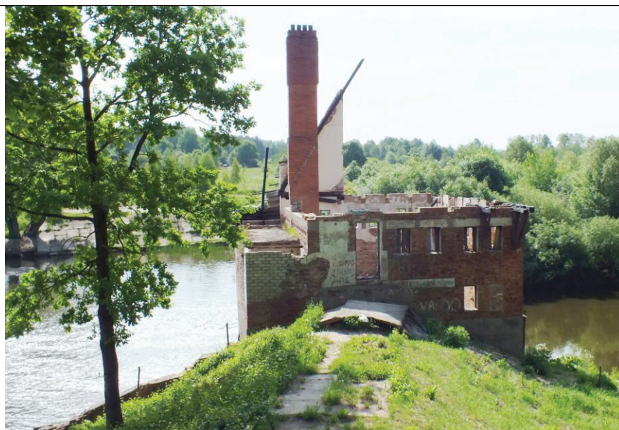
Nr. 3-2 Pavadinimas Hidroelektrinės liekanos, Kranto g. Nr. 27