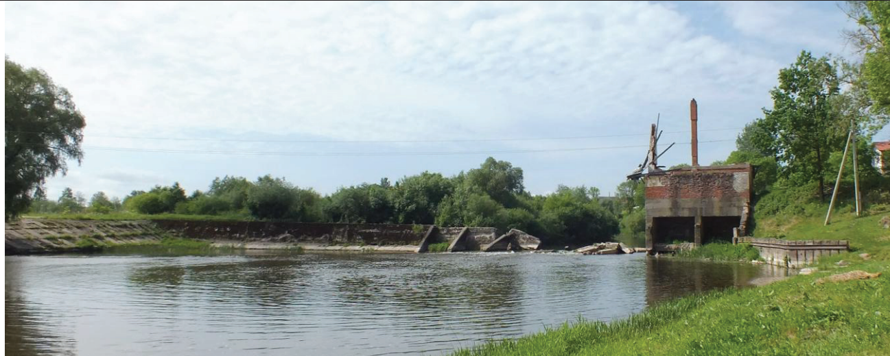
Nr. 3-2 Pavadinimas Hidroelektrinės liekanos, Kranto g. Nr. 27