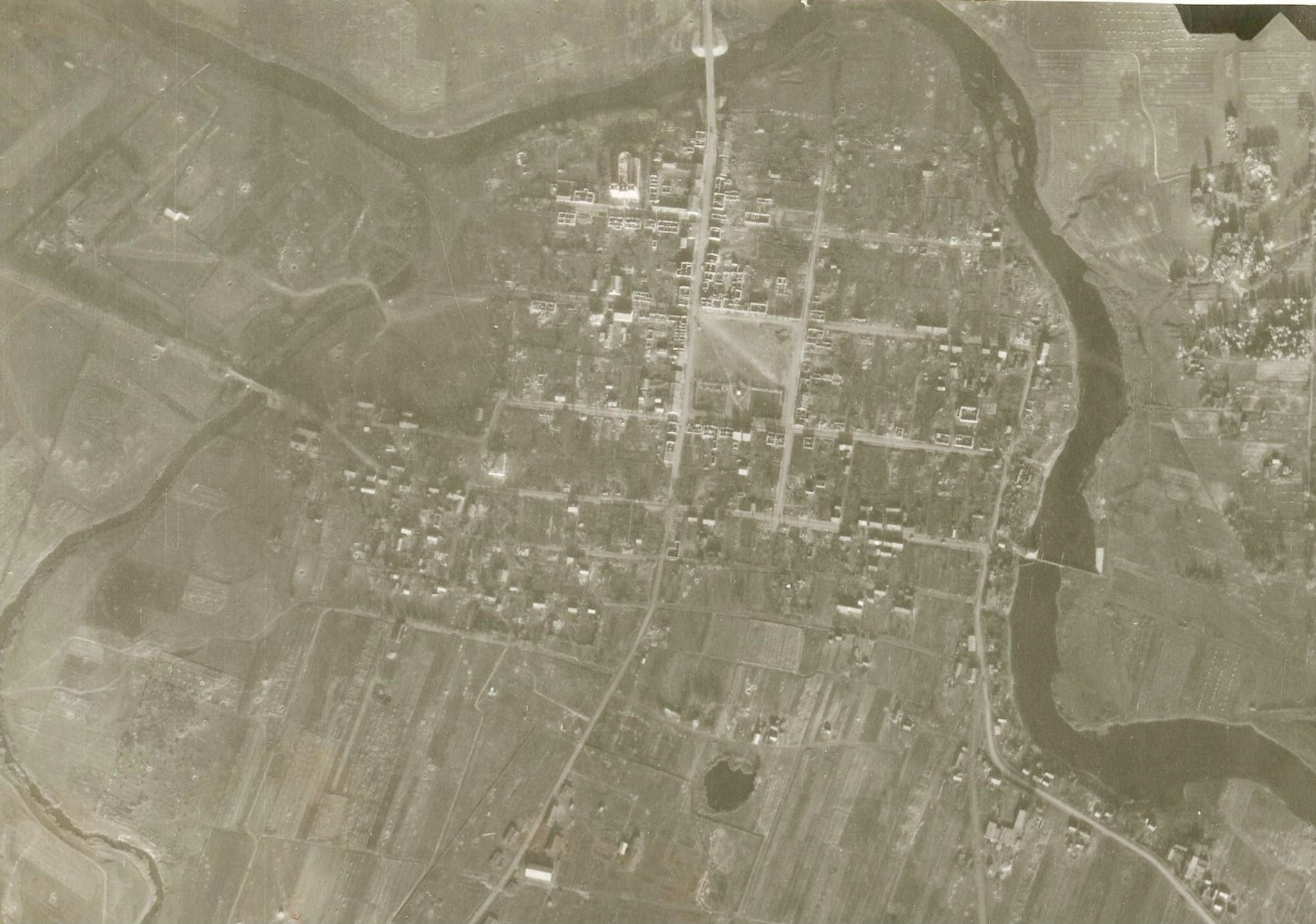
IKONOGR Nr. 9 Kudirkos Naumiestis 1944 aerofotografijoje. Lietuvos centrinio valstybės archyvo (LCVA) skaitmenintų aerofotografijų kolekcija iš JAV nacionalinio archyvo National Archives and Records Administration (NARA) RG 373, GX 12289 SD, l. 555