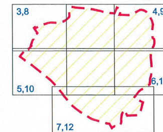
Lapų išsidėstymo schema

Nuoroda: Vietovės apibrėžtų ribų posūkio taškų koordinatės nurodytos 2 lape.