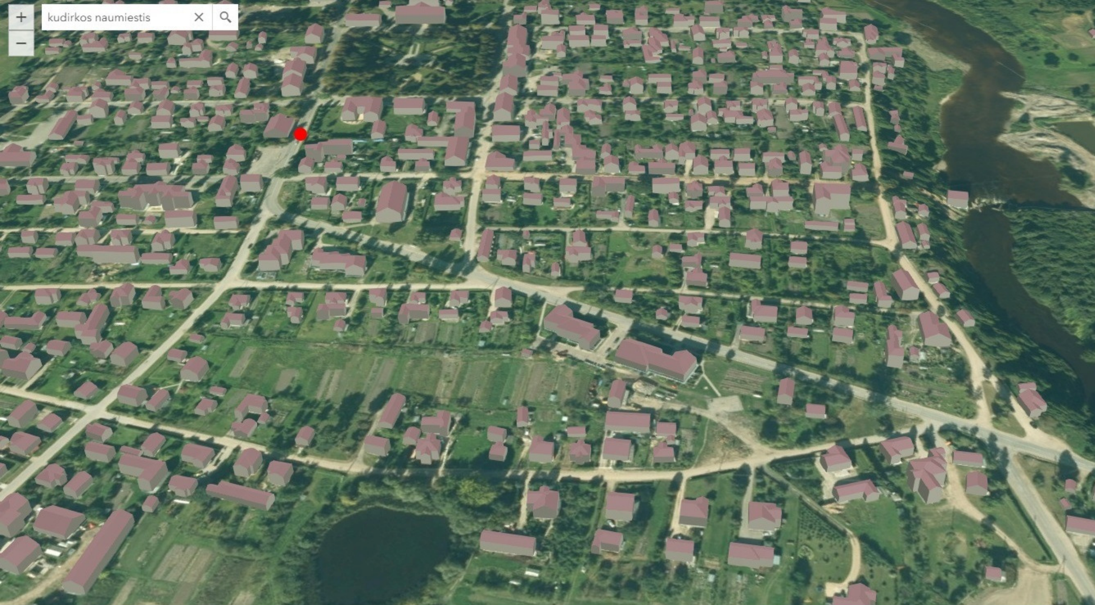
BR Nr. 7 Kudirkos Naumiesčio trimačio vaizdo fragmentas.