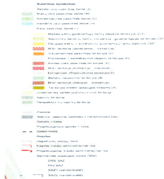
pav.1 ištrauka iš Radviliškio miesto bendrojo plano. Brėžinys žemės naudojimo apsaugos reglamentai (sutartiniai ženklai).