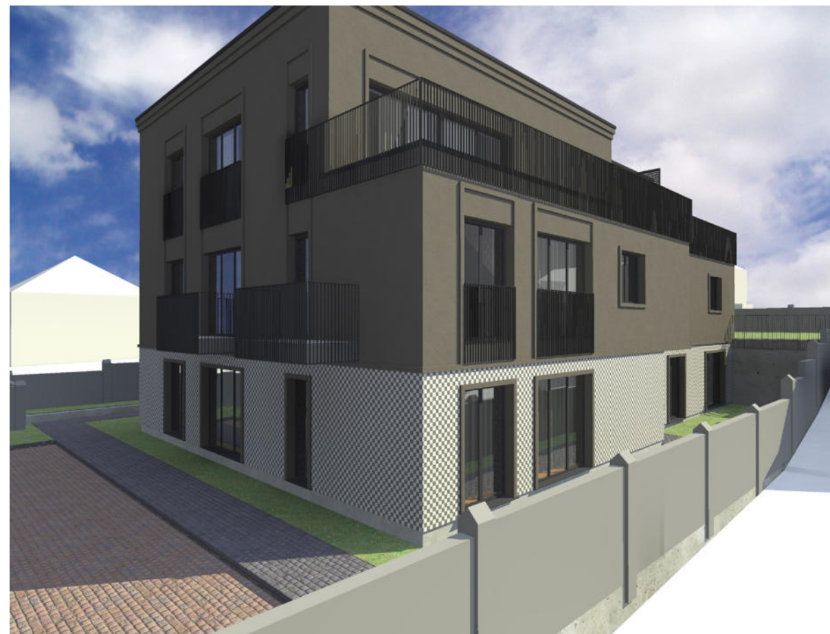
2. REKONSTRUOJAMO NAMO VAIZDAS ŽIŪRINT NUO VAKARINĖS PUSĖS