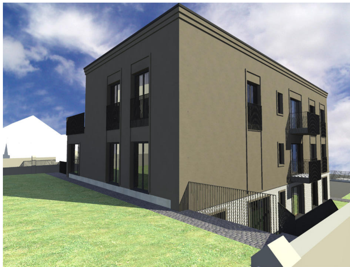
3. REKONSTRUOJAMO NAMO VAIZDAS ŽIŪRINT NUO RYTINĖS PUSĖS