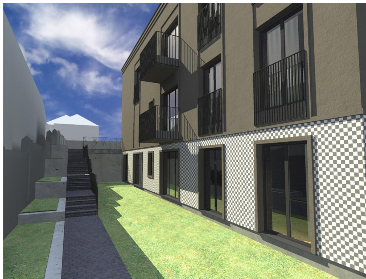
8. REKONSTRUOJAMO NAMO VAIZDAS ŽIŪRINT NUO ŠIAURINĖS PUSĖS