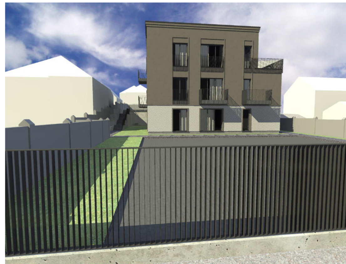
7. REKONSTRUOJAMO NAMO VAIZDAS ŽIŪRINT NUO RŪTŲ GATVĖS