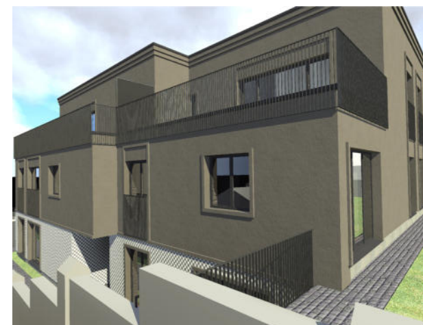
4. VAIZDAS ŽIŪRINT NUO PIETINĖS PUSĖS