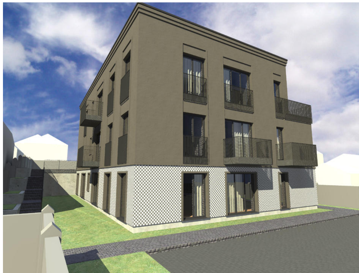
1. REKONSTRUOJAMO NAMO VAIZDAS ŽIŪRINT NUO ŠIAURINĖS PUSĖS