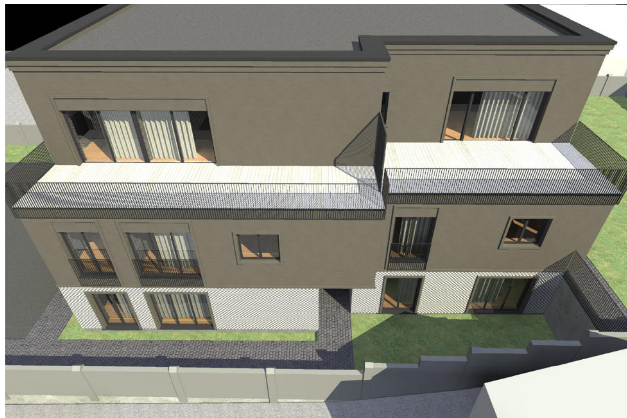
6. REKONSTRUOJAMO NAMO VAIZDAS (ŽIŪRINR IŠ PAUKŠČIO SKRYDIO)