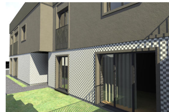
5. VAIZDAS ŽIŪRINT NUO PIETINĖS PUSĖS