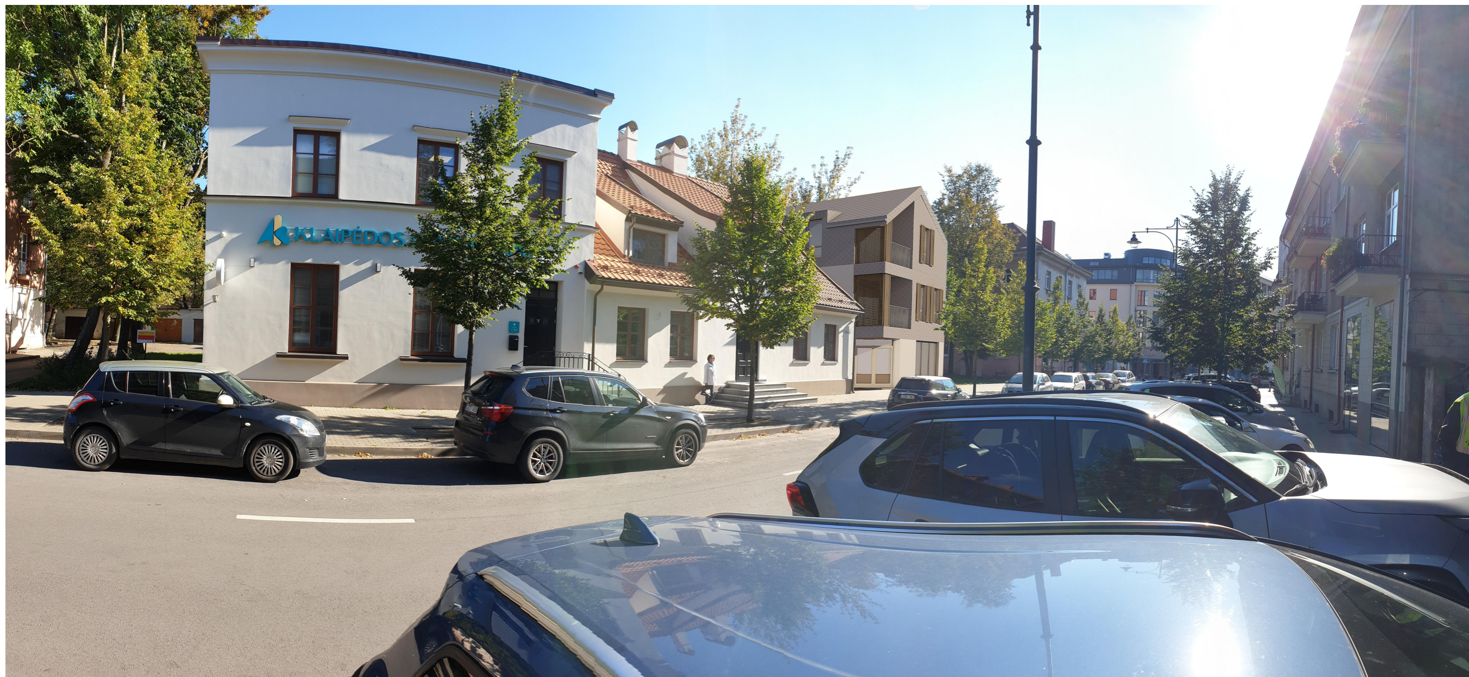
1:673,31 Vizualizacija su aplinka