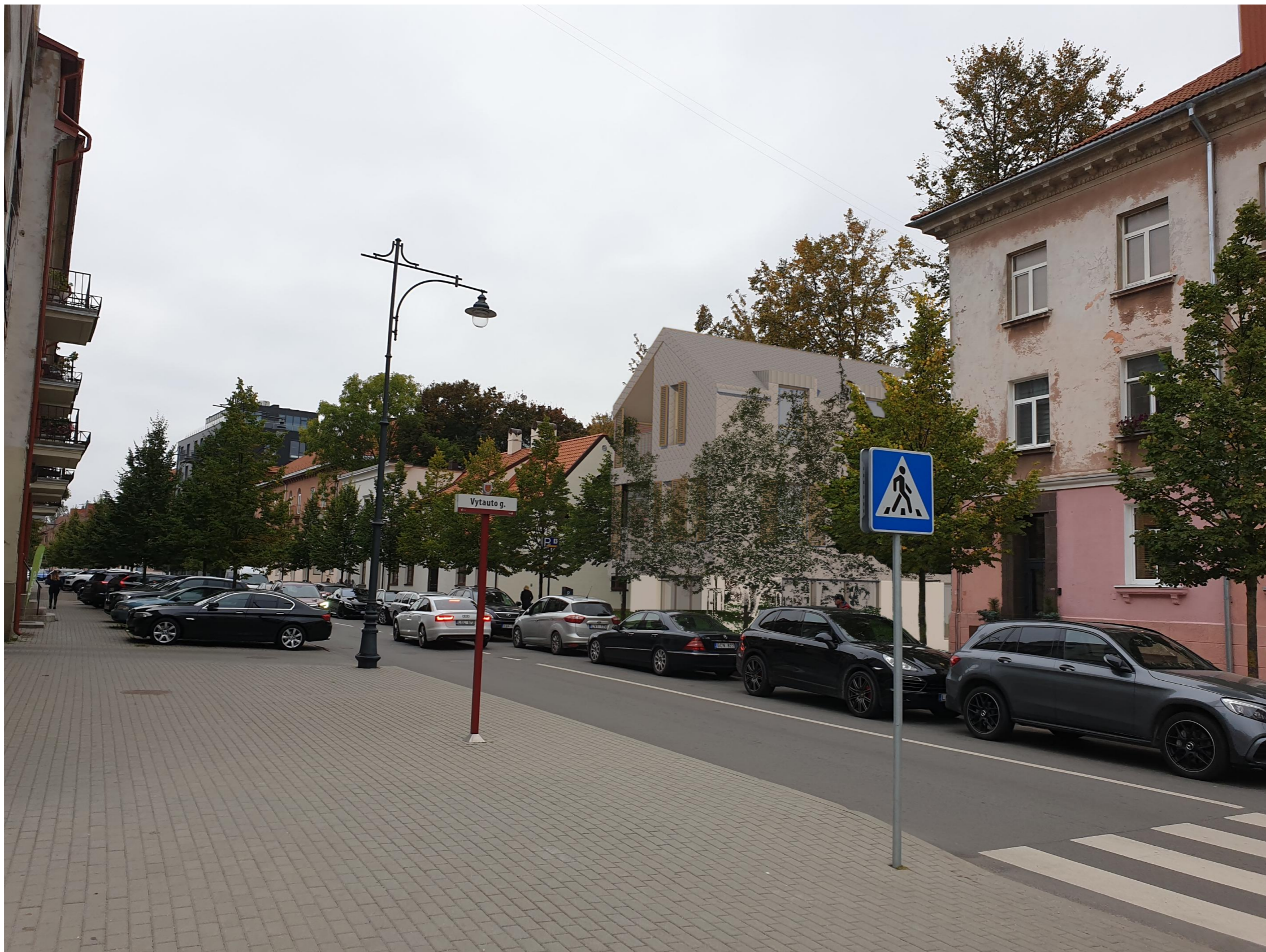
1:681,95 Vizualizacija su aplinka