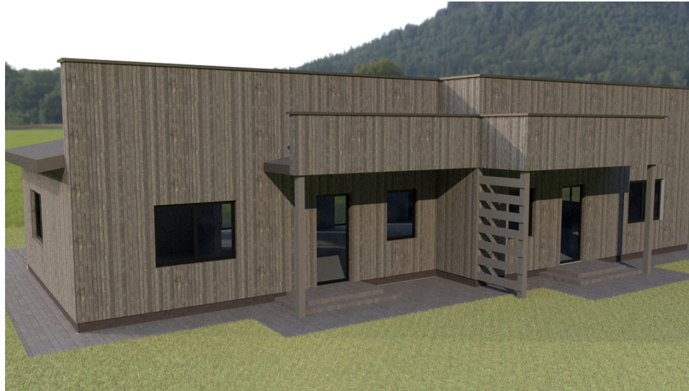
2 pav. VAIZDAS IŠ ŠIAURINĖS KIEMO PUSĖS