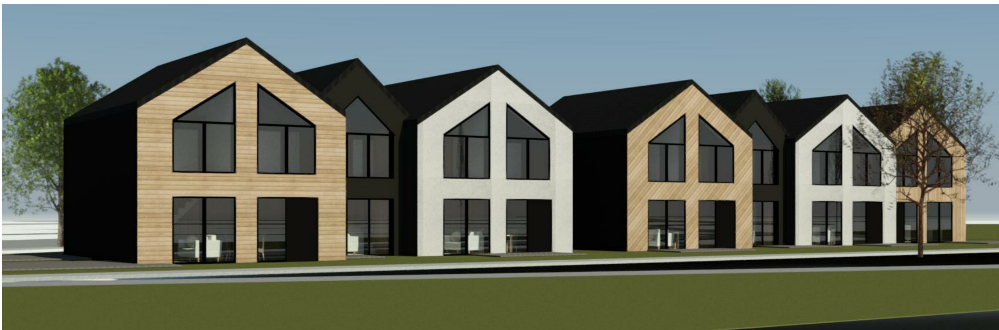
VAIZDAS IŠ RAŽĖS UPELIO PUSĖS