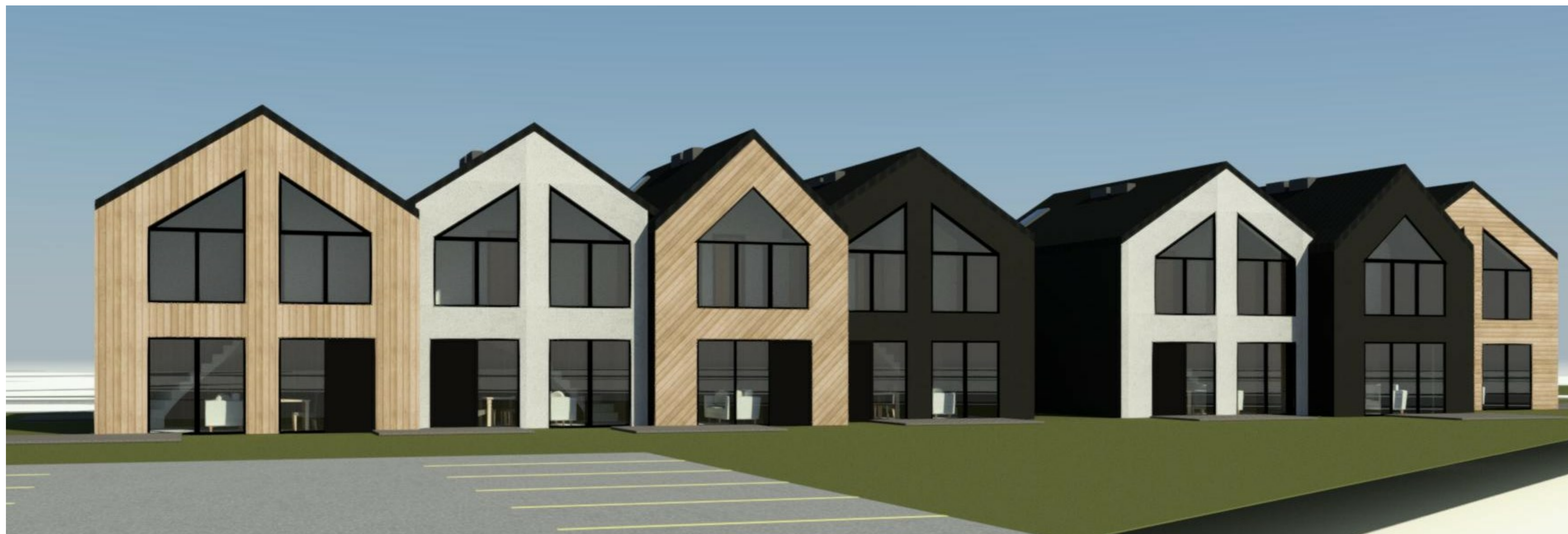
VAIZDAS IŠ ŽAROS GATVĖS PUSĖS