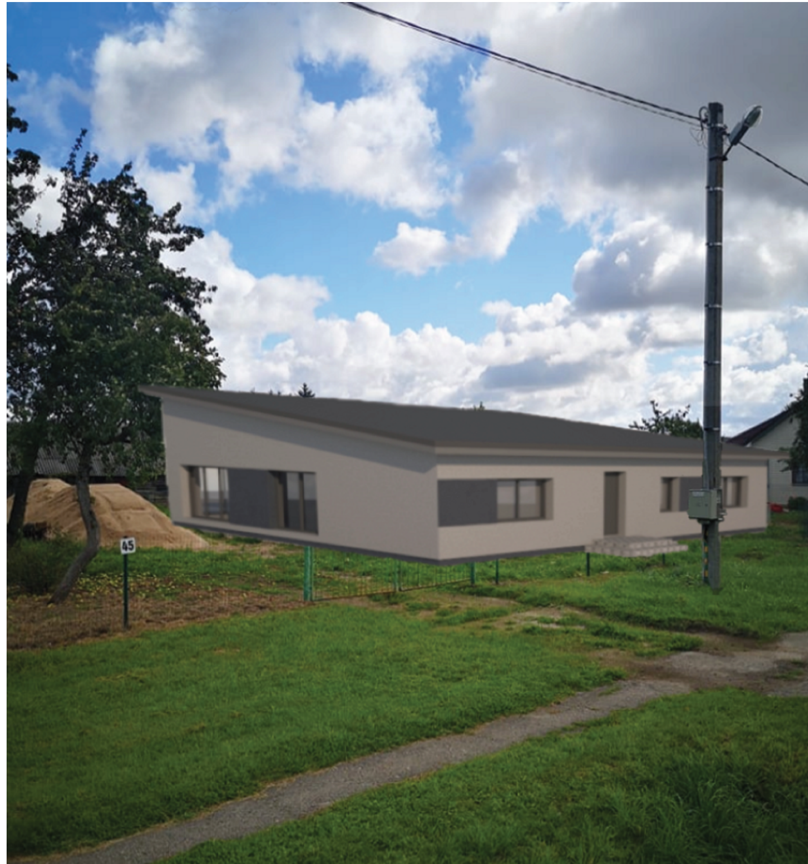
3pav. Vaizdas iš vakarų pusės