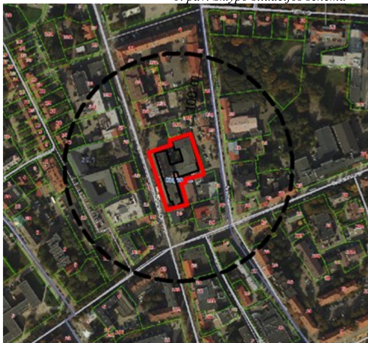
1. pav. Sklypo situacijos schema

Sklype (unikalus Nr. 2101-0003-0094), adresu H. Manto g. 36, Klaipėda yra trijų aukštų paslaugų pastatas. Patekimas į sklypą – iš Šaulių g. Pagal Nekilnojamojo turto registrų centro išrašą įregistruoti statiniai sklype – trijų aukštų paslaugų pastatas – Madų ateljė ir kiemo statiniai