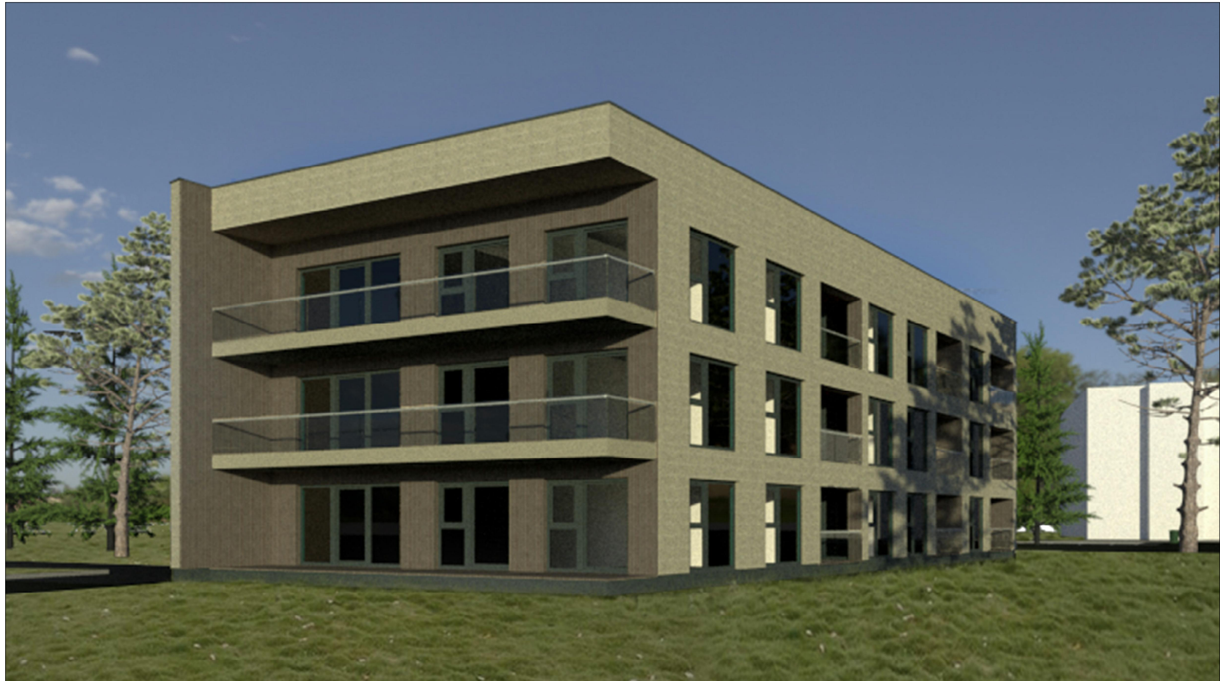
Architektūrinė vizualizacija (B)