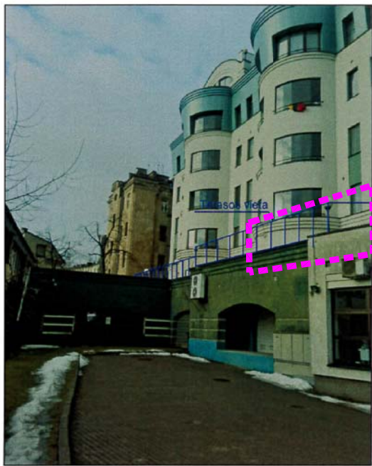
VAIZDAS IŠ TEATRO G. 9A KIEMO