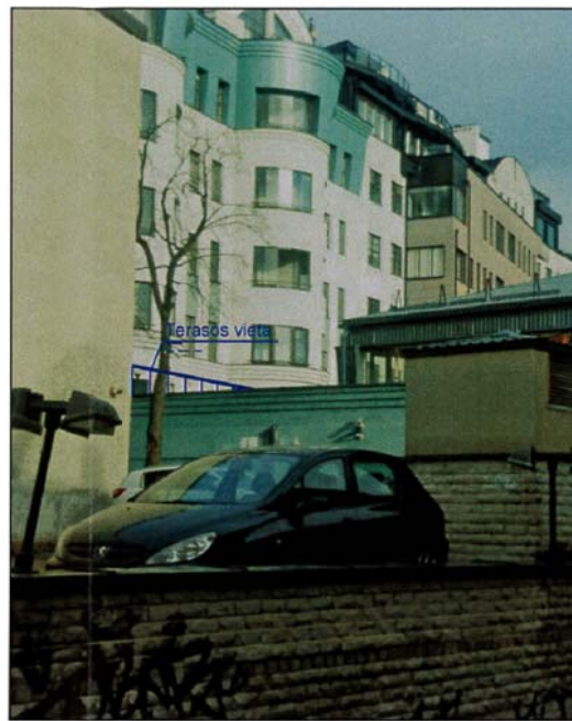
VAIZDAS IŠ PYLIMO G. 7A KIEMO