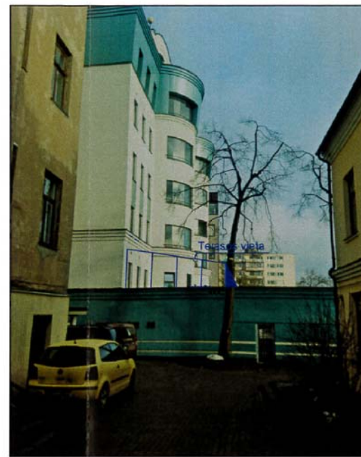
VAIZDAS IŠ TEATRO G. 9 KIEMO