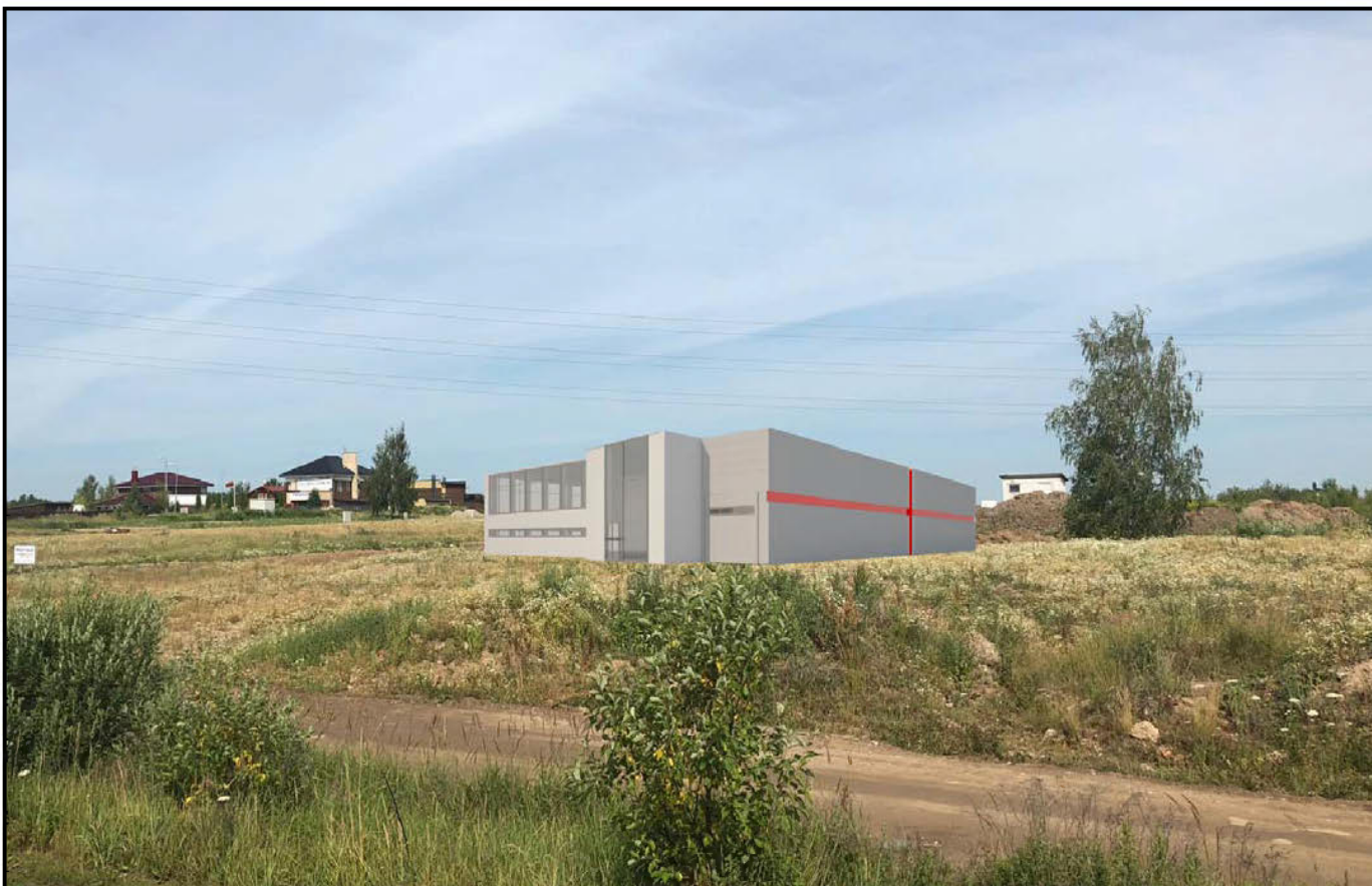
PASTATO VAIZDAS - PIETRYČIŲ PUSĖ