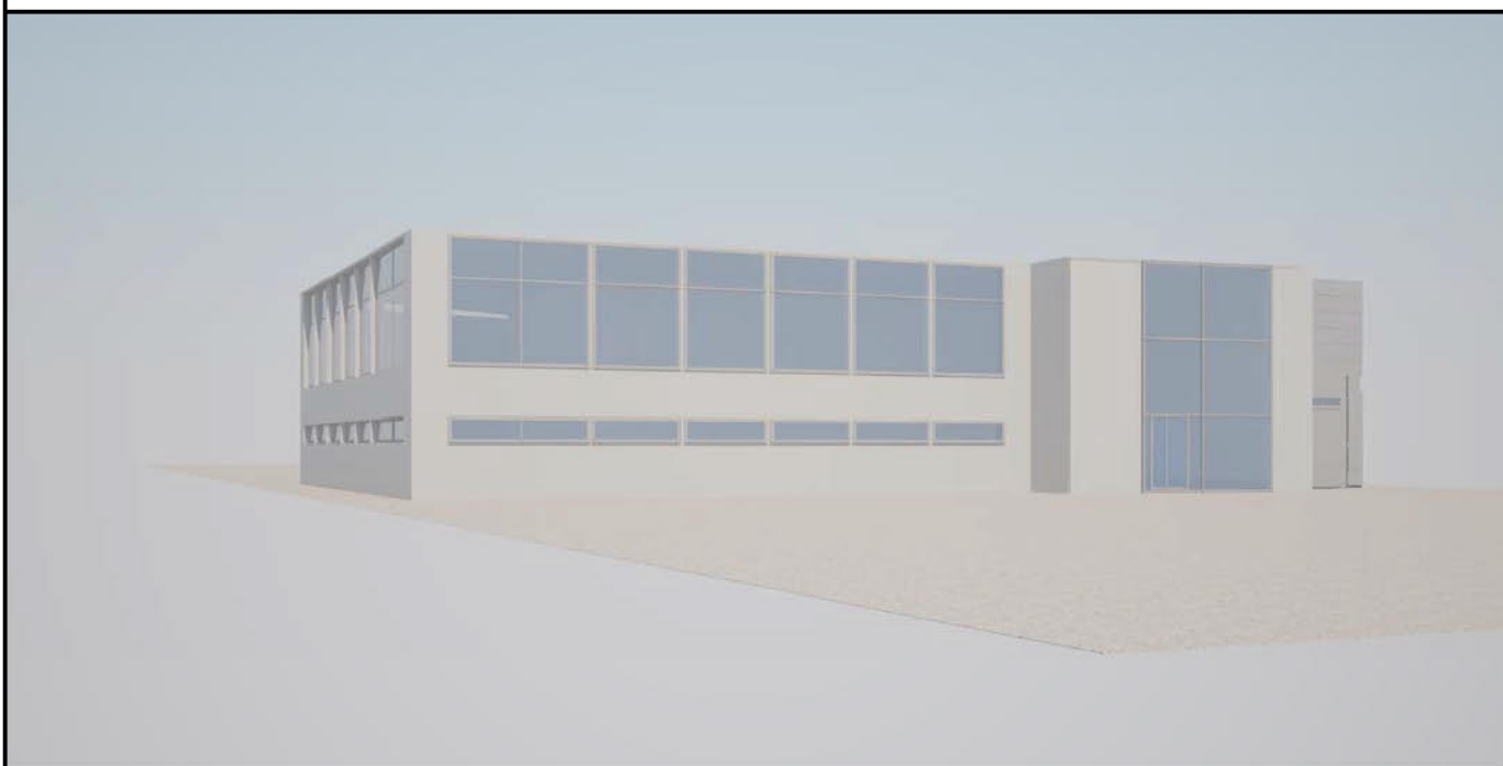
PASTATO PRIEKINIS VAIZDAS - PIETŲ PUSĖ