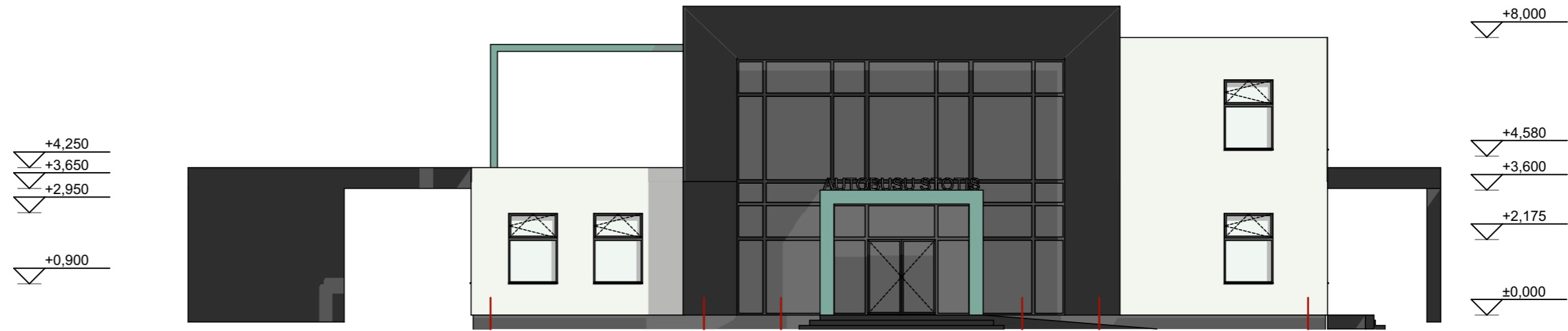
Fasadas A-D 1:150