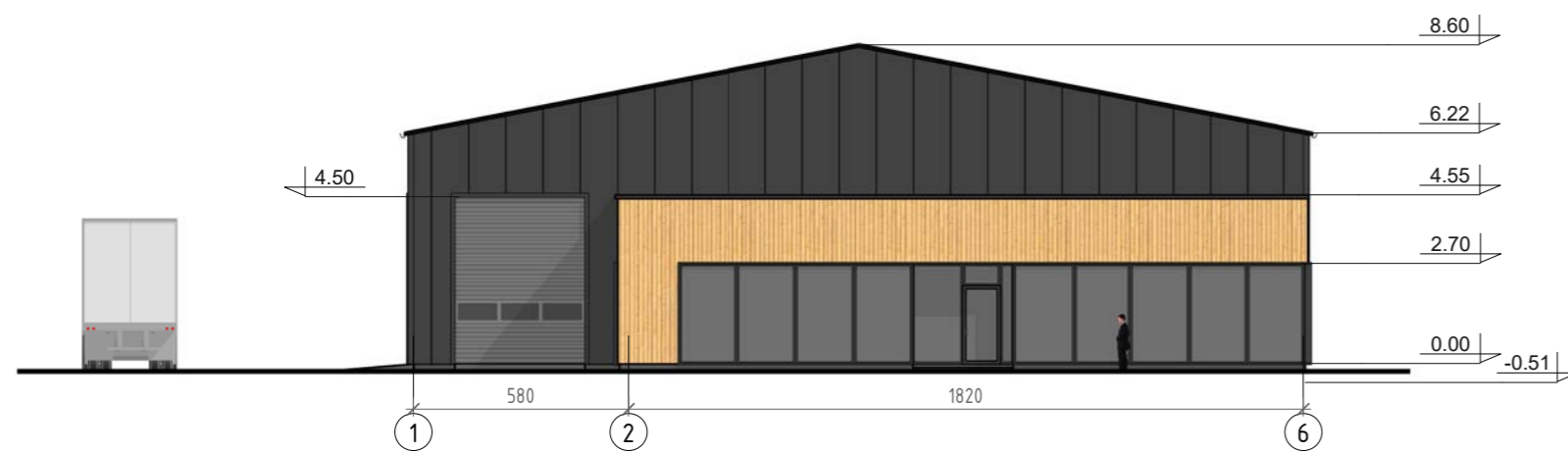
North-East facade. Entrance/office