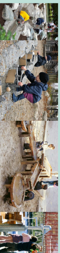
INTERAKTYVAUS EDUKACINIO KOMPLEKSO MAŽOSIOS ARCHITEKTŪROS ELEMENTAI. ANALOGAI