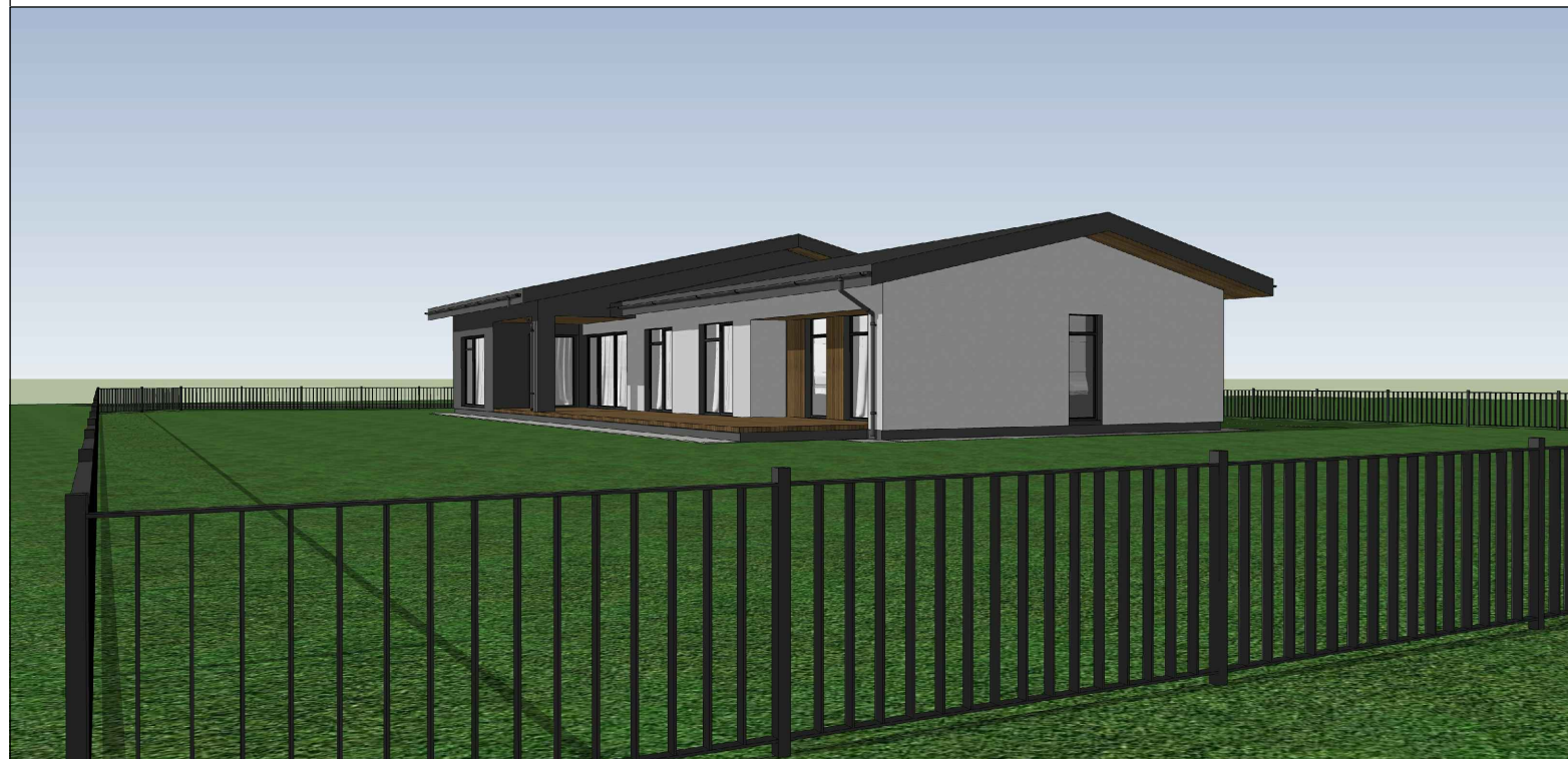
VAIZDAS IŠ PIETRYČIŲ PUSĖS