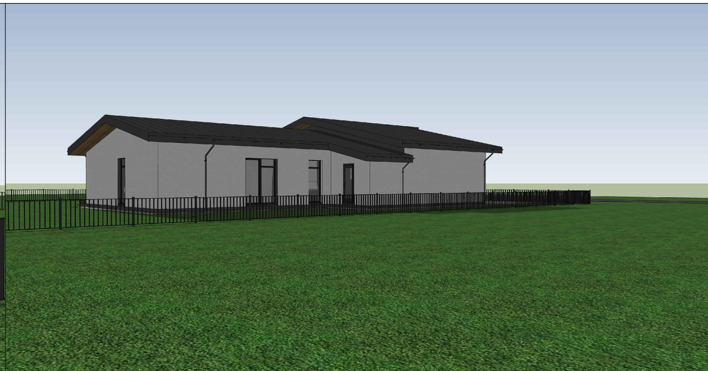
VAIZDAS IŠ ŠIAURĖS RYTŲ PUSĖS