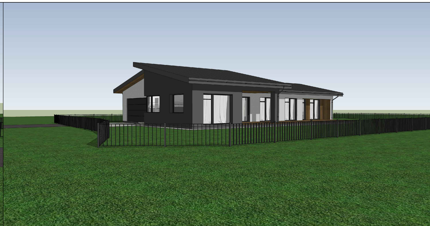
VAIZDAS IŠ PIETVAKARIŲ PUSĖS