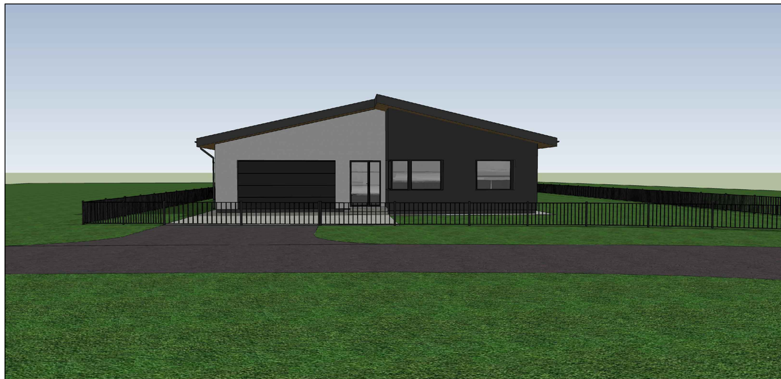
VAIZDAS NUO GATVĖS