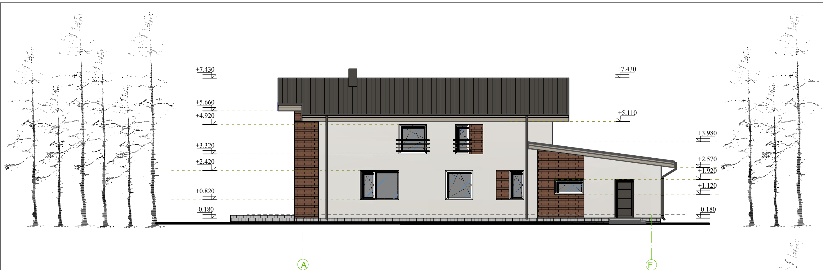
FASADAS TARP AŠIŲ A-F M 1:100