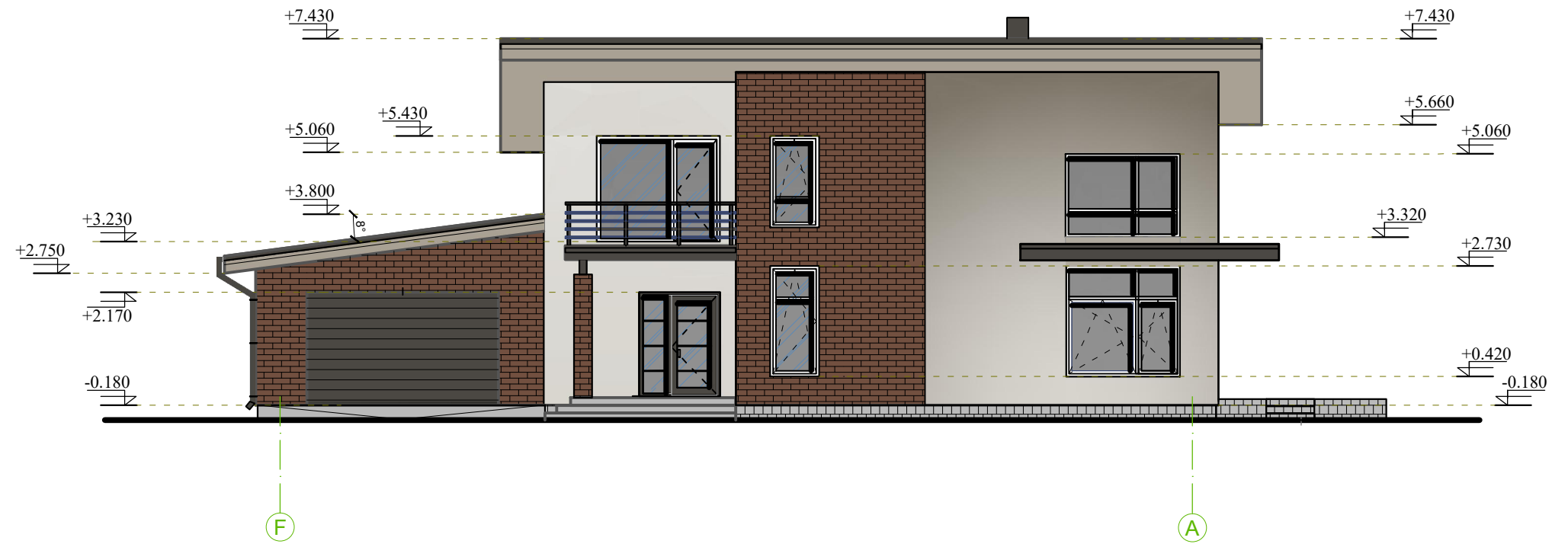
FASADAS TARP AŠIŲ F-A M 1:100