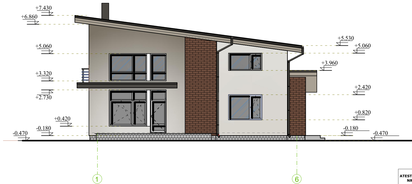
FASADAS TARP AŠIŲ 1-6 M 1:100