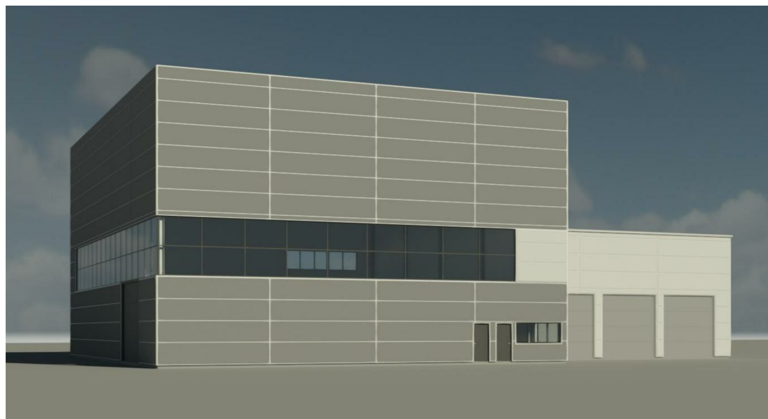
Vaizdas iš šiaurės rytų pusės