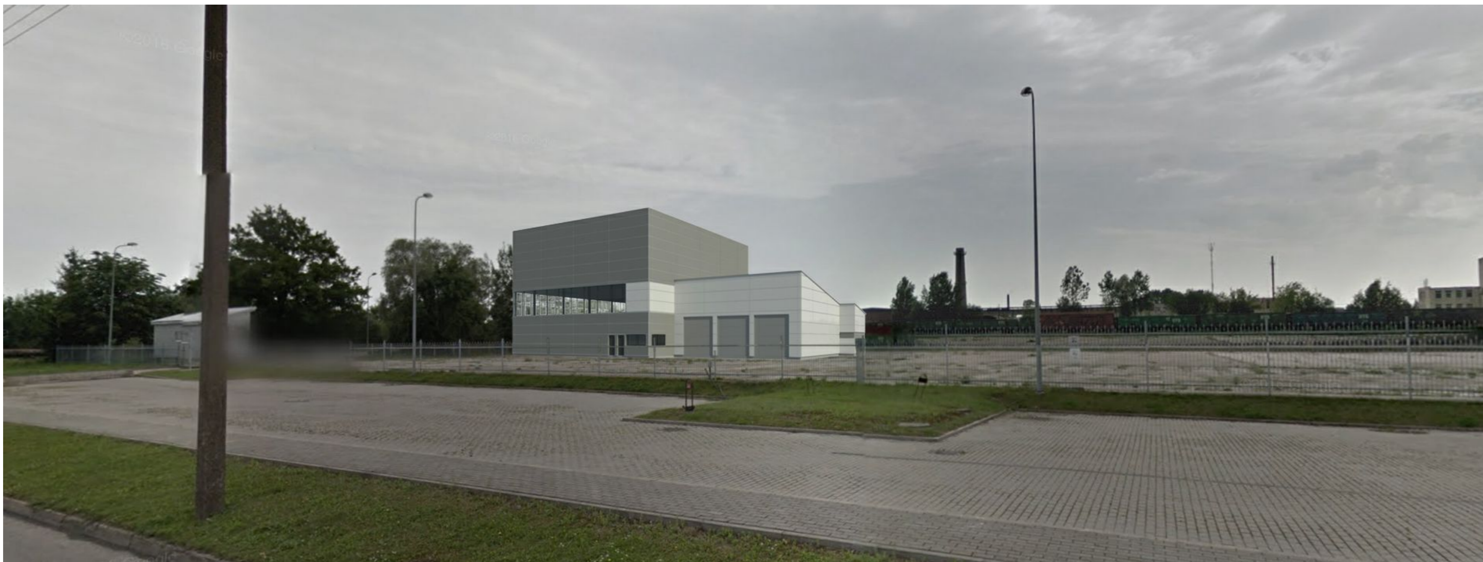
Vaizdas iš Statybininkų g.