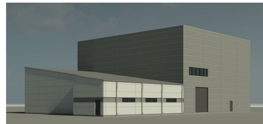
Vaizdas iš pietvakarių pusės